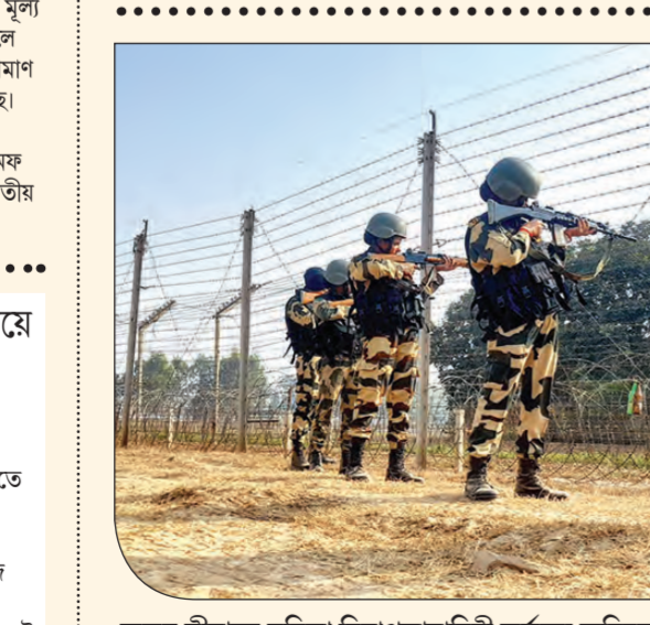
জন্মুর সীমান্তে মহিলা নিরাপত্তাবাহিনী কর্তব্যে অবিচল। বৃধবার।

হাতির প্রেম একগুচ্ছ ফুল দিয়ে প্রেমিকার মন জয়ের পরস্পরা চলছে যুগ যুগ ধরে। ভালোবাসার প্রকাশে ফুলের জুড়ি মেলা ভার। তাই বলে হস্তিকুলও পুষ্পপ্রেমিক! তাদেরও এমন রীতি আছে? একেবারে মানুষের ভঙ্গিতে গজরাজের অনুভূতির প্রকাশ দেখে উচ্ছ্বসিত নেটিভেনারা। ইনস্টাগ্রামের একটি ভাইরাল ভিডিওতে দেখা যাচ্ছে, একগুচ্ছ ফুল একটি পুরুষ হাতী ধীর পায়ে এগিয়ে দিচ্ছে এক হস্তিনীকে। ঠিক মানুষের মতো শুঁড়ে করে ফুল প্রেমিকাকে এগিয়ে দেওয়ার সময় পরম যত্নে সেই ফুল গ্রহণ করেছে প্রেমিনী। পা মুড়ে প্রেমে সায় দিয়েছে হস্তিনী। এমন প্রেম অবিশ্বাস্য মনে হলেও ছবি কিন্তু বুঝিয়ে দিয়েছে হস্তি-হস্তিনীর প্রেম কত গাঢ়। নেটাওয়ারকার বলাচ্ছে, 'ভালোবাসার জয় হোক'। এই হাতির প্রেম নিবেদনের দৃশ্য মন জয় করেছে লক্ষ লক্ষ মানুষের। হ্যাশট্যাগ এলিফান্টসঅফওয়ান্ত ভিডিওটি শেয়ার করে প্রশংসা কুড়িয়েছে।