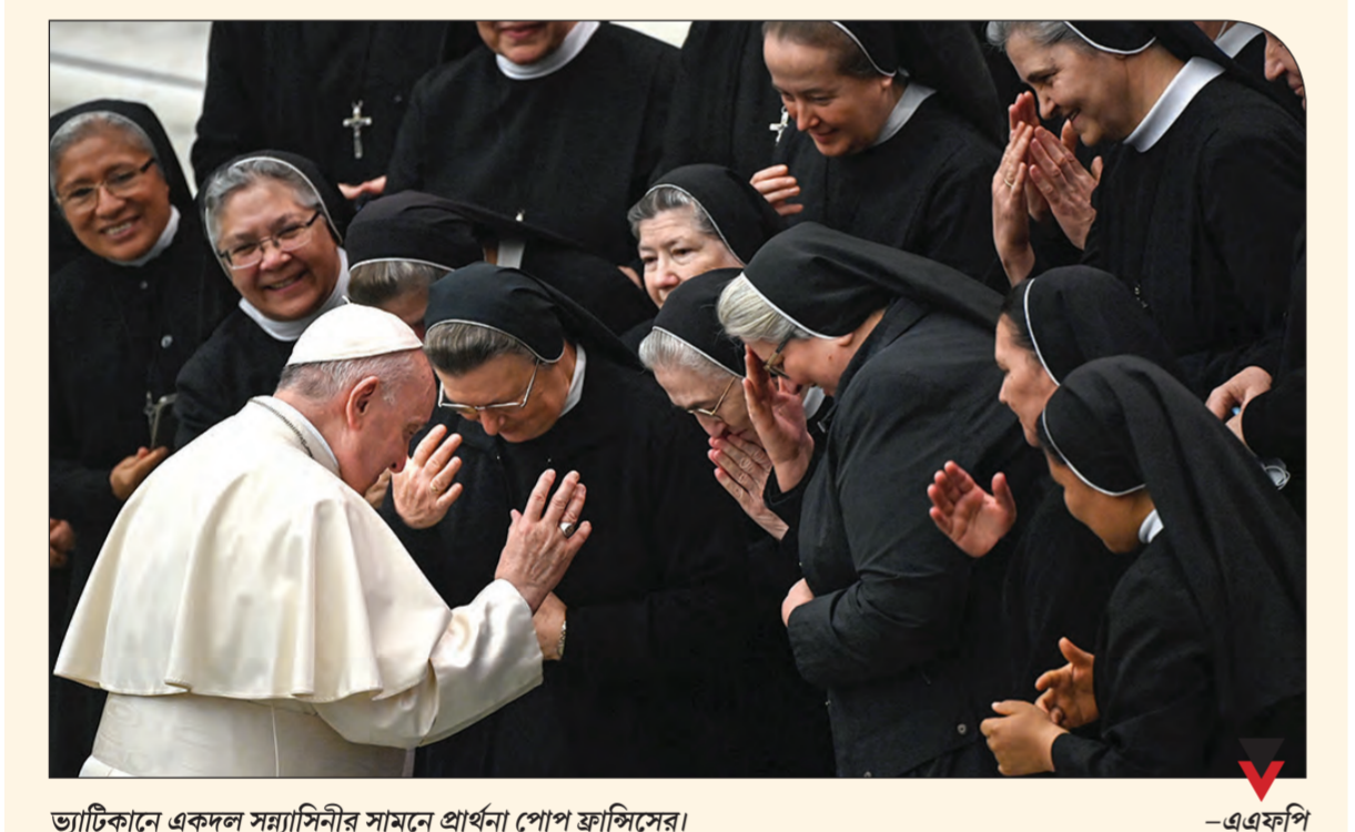
ভাটিকানে একদল সম্মানসিনীর সামনে প্রার্থনা পোপ ফ্রান্সিসের।

রেকর্ড মূল্যে আইনস্টাইনের পাণ্ডুলিপি নিলামে উঠল আইনস্টাইনের পাণ্ডুলিপি। প্যারিসের ক্রিস্টিজি তা বিক্রি হল রেকর্ড মূল্য ১ কোটি ৩০ লক্ষ ডলারে। ভারতীয় মুদ্রায় ৯৬ কোটি ৭৭ লক্ষ ২০ হাজার টাকা। পাণ্ডুলিপিটি ছিল আপেক্ষিকতাবাদ নিয়ে। ক্রিস্টিজের ওয়েবসাইটে বলা হয়েছে, সাধারণ আপেক্ষিকতাবাদের একেবারে গোড়ার দিকের যে দুটি হাতে লেখা পাণ্ডুলিপি হকিং মিলেছে, এটি তার অন্যতম। নিলামের শুরুতে এর মূল্য ২৪ থেকে ৩৫ লক্ষ ডলার উঠবে বলে অনুমান করা হলেও সবাইকে ভুল প্রমাণ করে চারগুণ বেশি দামে বিক্রি হয়েছে। আসে নোবেলজয়ী আইনস্টাইনের লেখা 'লেটার অ্যান্ড উইথ দ্য সিক্রেট অফ হ্যাপিনেস' নিলামে বিক্রিহলে ভারতীয় মুদ্রায় প্রায় সাত ১১ কোটি টাকায়।