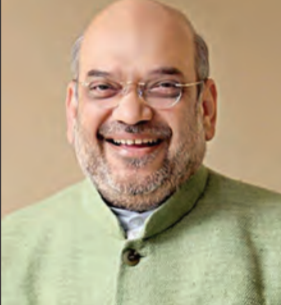
প্রত্যাহারের প্রতিশ্রুতি পেয়ে বোকা বনে গলে চলবে না। কৃষি ক্ষেত্রে আরও নিয়ন্ত্রণের পরিকল্পনা করছে কেন্দ্রীয় সরকার। কৃষক নেতৃত্বের দাবি,

বিশেষ সংবাদদাতা, নয়াদিল্লি, ২৪ নভেম্বর : সম্প্রতি একটি গেজেট নোটিফিকেশন জারি করা হয়েছে কেন্দ্রের তরফে। আর তাই নিয়ে নতুন করে বিতর্কের দানা বেঁধেছে কেন্দ্রীয় রাজনৈতিক মহলে। সেখানে দেখা যাচ্ছে, কৃষি সংক্রান্ত সংসদীয় স্থায়ী কমিটিতে রয়েছে অমিত শা'র হাতে থাকা সমবায় মন্ত্রক। অর্থাৎ কৃষিমন্ত্রী না হয়েও কৃষিমন্ত্রকের যাবতীয় খুঁটিনাটিতে তল্লাষ হুঁড়িয়েছে বিক্ষোভ।