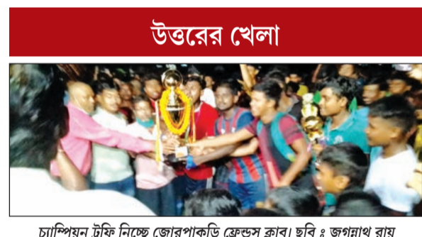
চ্যাম্পিয়ন ট্রফি নিচ্ছে জোরপাকড়ি ফ্রেডস ক্লাব।