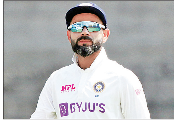
জর্করি সাফল্যের জন্য। এদিন এবির 'ইনটেন্ট' ট্রেনিং সেশনের ভিডিও

দুবায়ে, ১৩ সেপ্টেম্বর : ব্রিটিশ রাজধানীকে গুডবাই জানিয়ে বুর্জ খালিফার শহরে। কোয়ারাটিন কাটিয়ে আইপিএল-মোড়ে ঢুকে পড়ার অপেক্ষা। তবে ইংল্যান্ড সিরিজের পরিণতিটা কিছুতেই মন থেকে ঝেড়ে ফেলতে পারছেন না বিরাট কোহলি। আরসিবি'র টিম হোটেলের নিভৃতবাস থেকে আক্ষেপটা জানিয়ে দিলেন ভারত অধিনায়ক। ম্যাগ্‌ফেস্টার টেস্ট বাতিলে কোহিড পরিস্থিতির কোনও দাবী করলেন। বিরাটের যুক্তি, যে পরিস্থিতি ছিল, তাতে যে কোনও সময় যে কোনও কিছু ঘটতে পারত। ভারত অধিনায়কের আশা, আইপিএল কঠোর বায়ো-বাল পরবেশ থাকবে। প্রত্যেকেই তা