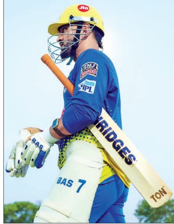
মহেন্দ্র সিং খোনি চললেন প্রায়কটিসে। রবিবার দুবায়ে।

দুবায়ে, ১৩ সেপ্টেম্বর : ইংল্যান্ড সফর ছিল। এবার চ্যালেঞ্জ আইপিএল। ভারতীয় দলের জার্সি সরিয়ে চেম্বাই সুপার কিংসের হলুদ জার্সিতে নয়া লক্ষ্যে নেমে পড়া। যেখানে আবারও পাশে দীর্ঘদিনের সতীর্থ, মেন্টর মহেন্দ্র সিং যোনি। খুশিটা আড়ালও করছেন না সুপার কিংসের অন্যতম স্তম্ভ রবীন্দ্র জাদেজা। রবীন্দ্রের অধীনে সরিয়ে ইংল্যান্ড সফরে দলের এক নম্বর স্পিনারের দায়িত্ব পেয়েছেন। রবিন ফ্যাটে বিরাট কোহলি ত্রিগেডের নিয়মিত সদস্য। এতকিছুর পরও ভারতীয় দলে 'মেন্টর' মাহিকে মিস করেন অভিজ্ঞ স্পিন-অলরাউন্ডার। জাদেজার কথায়, কোনও ভুলচুক হলে এক-এস খুঁটে এসে তা ধরিয়ে দিতা কী করতে হবে, গাইড করতে। আজ এক সাক্ষাৎকারে জাদেজা বলেছেন, 'প্রায় ১২ বছরের বন্ডি। মিস করি মাহিভাইকে। সবসময় আমাকে গাইড করতে। বরাবর একটা কথা বলত, সুযোগ পেলে তা কাজে লাগাও। আর কঠিন সময়ে মাহিভাইয়ের ব্যাটিং টোটকা-ব্যাটসম্যানরাই নয়, চাপে থাকে বোলাররাও। সেটা মাথায় রাখলে কাজ অনেক সহজ হয়ে যায়। আমার ক্রিকেট