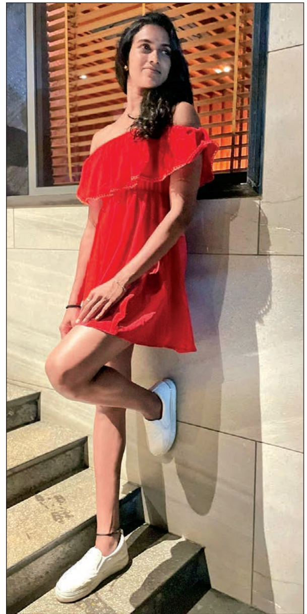
কোর্টের পাশাপাশি ফ্যাশনেও কম যান না পিভি সিদ্ধা। রবিবার।

নয়াদিল্লি, ১৩ সেপ্টেম্বর : বর্তমানে বিশ্বের সেরা বোলার। জসপ্রীত বুমরাহর প্রশংসকের তালিকায় এবার কপিল দেবও। শর্ট রানআপ, অদ্ভুতভায়ে বোলিং আকর্ষণ দেখে বিশ্বজয়ী অধিনায়ক বুঝতে পারেননি ছেলেরা এতদূর যাবে। সেই বুমরাহ অবাক করে চলেছে। ভেঙেছে তাঁরই ৪১ বছর পুরনো রেকর্ড। ইংল্যান্ড সফরে ভারতীয় বোলার হিসেবে দ্রুততম ১০০ উইকেটের নজির গড়েছেন। উত্তরসূরির যে সাফল্যকে প্রশংসায় ভরিয়ে দেন কপিল। বুমরাহয় মুগ্ধ কিংবদন্তি অলরাউন্ডার বলেছেন, 'বুমরাহর সাফল্যকে আমি কুর্নিশ জানাতে চাই। এই ধরনের উইকেট কীভাবে উইকেট নিতে হয় ও জানে। ওর বোলিং আকর্ষণ বেরকম তাতে কাজটা আরও কঠিন। তারপরও ভারতের হয়ে আন্তর্জাতিক ক্রিকেট প্রভাব রাখবে বুমরাহ। প্রশংসা ওর প্রাপ্য।' বুমরাহর প্রশংসায় এখানেই থামতে নারাজ সর্বাধিক টেস্ট উইকেটের প্রাক্তন মালিক। কপিলের দাবি, 'আন্তর্জাতিক ক্রিকেটে যখন ওর অভিজ্ঞতা হার, নিশ্চিত ছিলাম না আসে ও টেস্ট খেলতে পারবে কিনা। গুডাইআই ও টি২০ ক্রিকেটে আগেই নিজের দক্ষতার প্রমাণ রেখেছিল। টেস্ট ফরম্যাটে বুমরাহ সবাইকে কার্যত চমকে দিয়েছে। ওয়েস্ট ইন্ডিজ, অস্ট্রেলিয়া যেক বা ইংল্যান্ড-সব জায়গায় ও সফল। নিশ্চিতভাবেই এই মুহূর্তে বিশ্বের সেরা বোলারের নাম বুমরাহ।' ২০১৮ সালে টেস্ট অভিষেক ঘটে বুমরাহর। এক বছর কাটতে না কাটতেই ভারতের দ্রুততম ৫০ উইকেটের নজির পকেটে পুরে ফেলেন। ইরফান পাঠান, হরভজন সিংয়ের পর তৃতীয় ভারতীয় হিসেবে টেস্টে হ্যাটট্রিকও করেছেন। এবার মুকুটে দ্রুততম সফের উইকেট। কপিল দেব ২৫টি টেস্টে একশো উইকেট নিয়েছিলেন। বুমরাহর সেখানে লাগল এক টেস্ট কম।