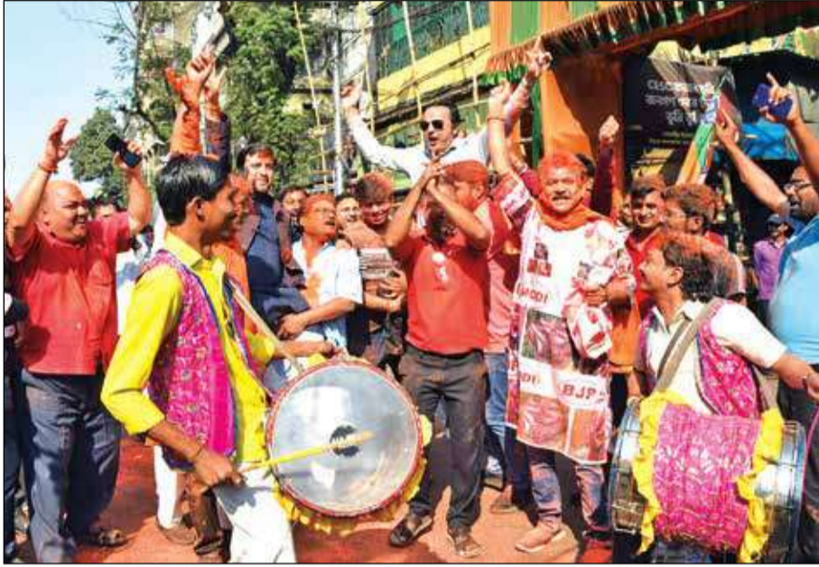
দিল্লির গেরুয়া বাড়ে বঙ্গের পদ্ম সমর্থকদের উল্লাস। শনিবার কলকাতায়।

২০২৬ সালে বিজেপির এই রাজ্য দখলের মন্তব্যকে 'দিবাস্বপ্ন' বলেছেন রাজ্যের পঞ্চায়ত, গ্রামোন্নয়ন ও সমবায় দপ্তরের মন্ত্রী