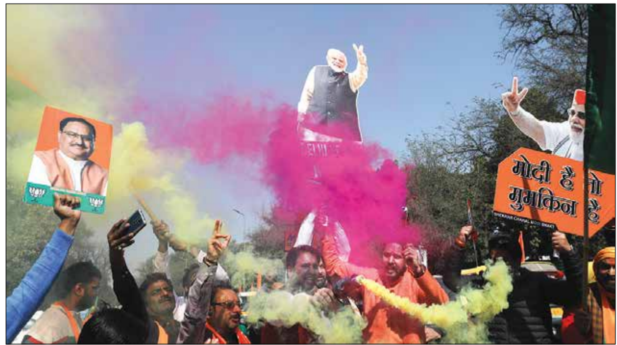
জয়ের উল্লাস। ২৭ বছর পর দিল্লিতে ক্ষমতায় ফিরে বিজেপির সদর দপ্তরের সামনে উল্লাস কর্মী-সমর্থকদের। শনিবার নয়াদিল্লিতে।

বেশি। বোঝাই যাচ্ছে যে ভোট বিভাজনের কারণে আপের ক্ষতি হয়েছে।