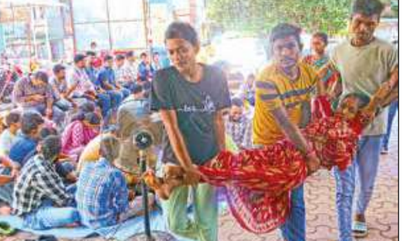
স্ট্রেচার নেই। পাঁজাকোলা করে নিয়ে যাওয়া হচ্ছে রোগীকে।