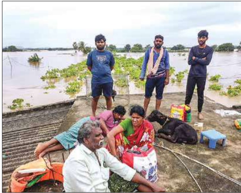
কিশোরীকে কাঁধে চাপিয়ে নিরাপদ স্থানে নিয়ে চলেছেন উদ্ধারকারীরা। (ডানদিকে) উদ্ধারের অপেক্ষায় বাড়ির ছাদের ওপর বসে পরিবার। বিজয়ওয়াড়ায়।