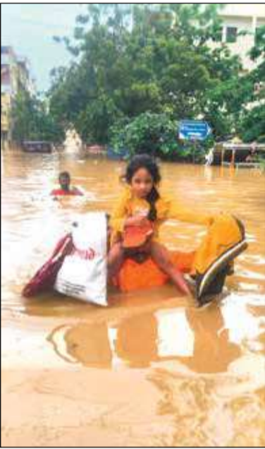
কিশোরীকে কাঁধে চাপিয়ে নিরাপদ স্থানে নিয়ে চলেছেন উদ্ধারকারীরা। (ডানদিকে) উদ্ধারের অপেক্ষায় বাড়ির ছাদের ওপর বসে পরিবার। বিজয়ওয়াড়ায়।

আরএসএস। কিন্তু একে ভোট রাজনীতিতে ব্যবহার করা অনুচিত। সরকারের উচিত তথ্য সংগ্রহের জন্য জাতভিত্তিক গণনা করা। মনে রাখতে হবে এটি একটি স্পর্শকাতর বিষয়।