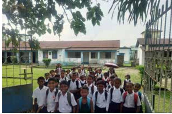
স্কুল ছুটির পর বাড়ি যাচ্ছে টুডু টিজি খ্রি প্রাথমিক স্কুলের খুদেরা।