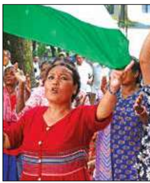
শ্রমিক ভবনের সামনে পাহাড়ের চা শ্রমিকদের বিক্ষোভ।

সমস্যা মেটাতে মঙ্গলবার ফের ত্রিাঙ্গিক বৈঠক ডেকে সোমবার মধ্যরাতে প্রতিটি শ্রমিক সংগঠনকে ই-মেল করেন অতিরিক্ত শ্রম অধিকর্তা। সেখানে বলা হয়, বোনাস নিয়ে মঙ্গলবার সকালে বৈঠক হবে। কিন্তু এত স্বল্প সময়ে সংগঠনের প্রত্যেককে জানিয়ে বৈঠকে হাজির