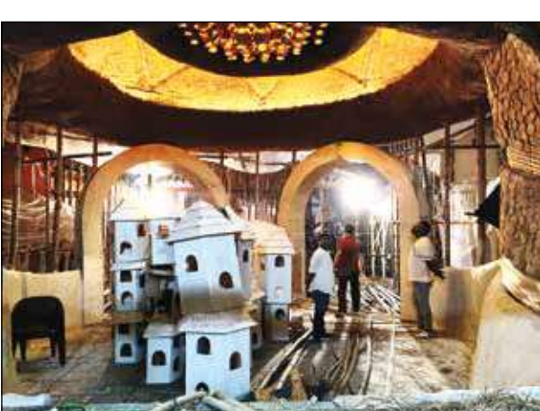
সংখশ্রীর পুজোমণ্ডপে কাজ চলেছে জোরকদমে। মঙ্গলবার। -তপন দাস

শিলিগুড়ি, ১ অক্টোবর : উৎসবের দিনগুলোতে মানুষের বাঁধাভাঙা উচ্ছাস এই পাড়ার পরিচিত। একদিকে সংখশ্রী, অন্যদিকে সুভাষ স্পোর্টিং ক্লাব। পুজোর দিনগুলোতে ভিড় টানতে যেন অযোযিত প্রতিযোগিতা চলে দুইয়ের মধ্যে। বিগবাজেটের পাশাপাশি শহরবাসীর নজর কাড়ে কম বাজেটের পুজোটিও। প্রতিমা থেকে মণ্ডপ, আলোকসজ্জা সহ সামগ্রিক ব্যবস্থায় প্রতিবার মন জয় করে নেয় শিলিগুড়ির সুভাষপল্লি। যুব বড় আয়োজন না হলেও সুভাষপল্লি যুবক সংখের পুজো দেখতে দাঁড়ান রাস্তা দিয়ে যাতায়াতকারী প্রতিটা মানুষ। থিম ভাবনায় সবসময়ই আলাদা ছোঁয়া দেওয়ার চেষ্টা করেন উদ্যোক্তারা। এবার তাদের ৭০তম বর্ষ। সকাল থেকে পুজোর আয়োজনে ব্যস্ততা শুরু হয়ে যায়। তারপর দিনভর নেতাজি মোড়ের একটি নির্দিষ্ট জায়গায় বসে বন্ধুদের সঙ্গে আড্ডা