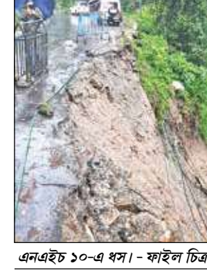
এনএইচ ১০-এ ধসা - ফাইল চিত্র

এদিন এনএইচ ১০ চালুর কথা সোমবারই জানিয়েছিলেন পূর্ত দপ্তরের ন্যাশনাল হাইওয়ে ডিভিশন-৯'এর এগজিকিউটিভ ইঞ্জিনিয়ার