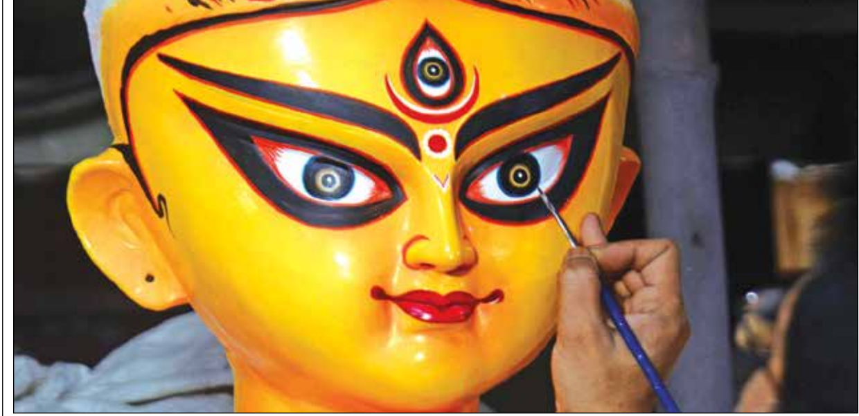
পিতৃপক্ষের অবসান। দেবীপক্ষের সূচনা আজ। চিম্মায় রূপ পাচ্ছে মুম্বায়ের মূর্তি। হাকিমপাড়ার কুমারটুলিতে।