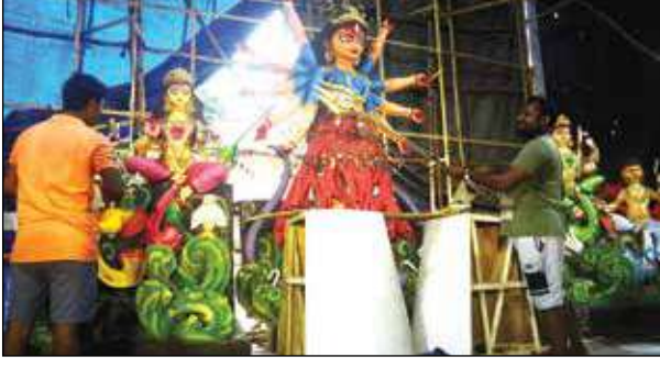
বুধবার ভার্চুয়ালি উদ্বোধন। মঙ্গলবার সুরত সংখের তৎপরতা।