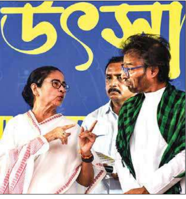
মঙ্গলবার কলকাতার শ্রীভূমিতে মমতা বন্দ্যোপাধ্যায় ও নচিকেতা।