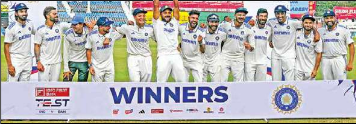
বাংলাদেশকে হারিয়ে ২-০ ব্যবধানে সিরিজ জয়ের পর ট্রফি নিয়ে টিম ইন্ডিয়ায় উল্লাস। কানপুরে মঙ্গলবার।