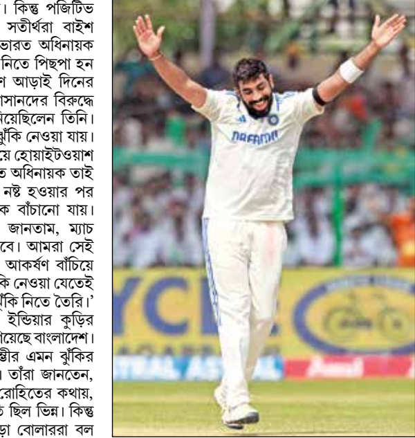
জসপ্রীত বুমরাহদের কর্ম আত্মবিশ্বাসী করছে রোহিতকে।