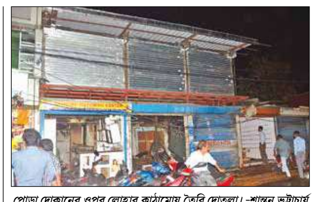
পোড়া দোকানের ওপর লোহার কাঠামোয় তৈরি দোতলা।