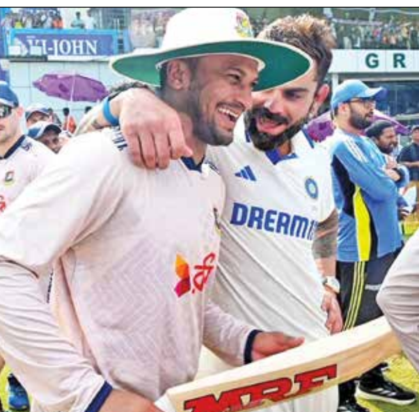
ম্যাচ শেষে সাকিব আল হাসানকে ব্যাট উপহার দিলেন বিরাট কোহলি।