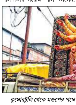
কুমোরটুলি থেকে মণ্ডপের পথে অসম্পূর্ণ প্রতিমা।

শেষ করে মহালয়ার জন্য অপেক্ষা করতাম। দেবীপক্ষের আচার মেনে মায়ের চোখ আঁকতাম। কিন্তু এখন আমাদের হাতে কিছু নেই।' তাঁদের হাতে যে অনেক কিছু নেই, তার ব্যাখ্যা দিতে গিয়ে হাকিমপাড়া-পালপাড়ার সরোজ পাল বললেন,