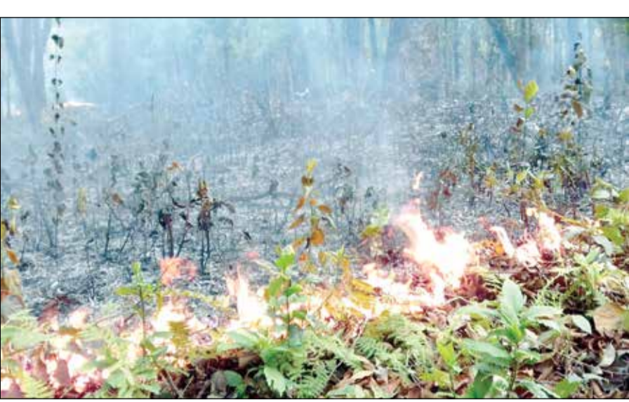
লাটাগুড়িতে বরাপাতায় আশুন। -সংবাদচিত্র

গয়েরকাটা, ২৬ মার্চ : গয়েরকাটা উচ্চবালিকা বিদ্যালয়ে পঞ্চম থেকে অষ্টম শ্রেণি পর্যন্ত অনগ্রসর ছাত্রীদের জন্য রয়েছে বিনামূল্যে ছাত্রী নিবাস। কিন্তু অষ্টম শ্রেণির পর সেখানে থাকার ব্যবস্থা নেই। এজন্য স্কুল ছুটের সংখ্যা বাড়ছিল।