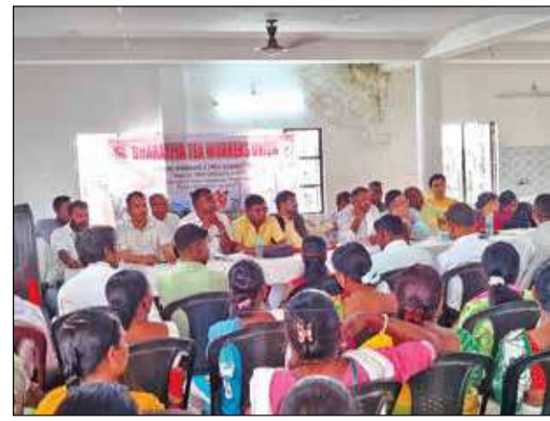
নাগরাকাটার অগ্রসেন ভবনে ভারতীয় টি ওয়াকার্পি ইউনিয়নের কেন্দ্রীয় কমিটির সভা। বৃহবার।

জমির ৩০ শতাংশ চা পতিতের জন্য তুলে দেওয়া হলে চা শিল্প খোর সংকটে পড়বে। এর বিরুদ্ধেই প্রতিবাদ। 'তিনি আরও জানান, টি ডিরেক্টরের পর শ্রমিকদের দাবিদাওয়া আদায়ে নবাম ও সিল্পের যন্ত্র মন্ত্রের অভিযান করা হবে।