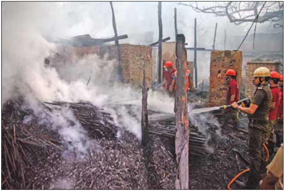
বেলঘাটায় বরফ কারখানার অদূরে হাটাই অগ্নিকাণ্ড। বৃথাবার।