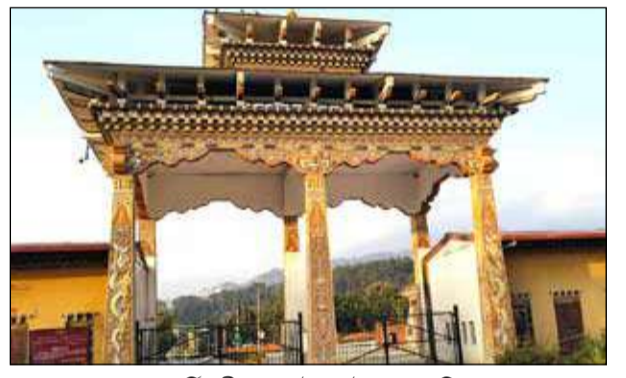
চামুটির সীমান্তে ভূটানগেট। - সংবাদচিত্র

নাগরাকাটা, ২৬ মার্চ : থিম্পু, পেশা কিংবা পাশাখা। প্রতিবেশী দেশে ভূটানের এসব পটে আঁকা ছবির মতো জায়গাগুলিতে ফি বছরই প্রচুর পর্যটক ভিড় জমান। ভূটান ভ্রমণের একমাত্র ইমিগ্রেশন সেন্টারটি রয়েছে রাজ্যের জয়গাঁয়। এখান থেকেই অনুমতি নিয়ে ফুটশোলিং হয়ে দুকতে হয় ভূটানের অন্দরে। পশ্চিম ডুয়ার্সের চামুটি সীমান্তের সামটি গেটে এবার আরও একটি ইমিগ্রেশন সেন্টার তৈরির দাবি উঠেছে। স্থানীয় পর্যটন ও ব্যবসায়ী মহলে এখন সেই দাবি তুমুল জোরালো হচ্ছে।