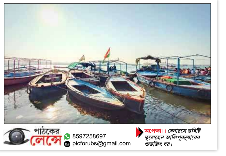
পাঠকের লেঙ্গে 8597258697 picforubs@gmail.com

পুরসভা সূত্রে খবর, এনিবে বিস্তারিত পুলিশি তদন্তের পক্ষে পুরসভা। নকল জন্ম শংসাপত্র চক্রের হদিস পাওয়ার আগে আপাতত পুরসভায় ডিজিটাল বার্থ সার্টিফিকেট তৈরি করাতে আসা সেই মহিলা ও তার সঙ্গী লোকটির খোঁজ পেতে চাইছে পুরসভা। তারা শহরের কোনও ওয়ার্ডের বাসিন্দা কিনা তা খুঁজতে পুলিশের পাশাপাশি পূর্ববঙ্গ ও কর্মীদের কাজে লগানো হচ্ছে। সেইসঙ্গে বিভিন্ন স্কুলে পড়ুয়া ভর্তির ক্ষেত্রে ব্যবহার করা সার্টিফিকেটগুলিও যাচাই করার ভাবনা রয়েছে পুরসভার।