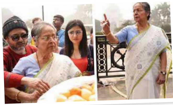
পর আইএফএফআই-এর মঞ্চে সবার সামনে রাখিদির কাছে কান মলা খেলোম। কেমন ছিল সেই অভিজ্ঞতা তা আপনাদের সঙ্গে ভাগ করে নেব ৯ মে। গোয়ার ৫৫তম আন্তর্জাতিক চলচ্চিত্র উৎসবে আমার বস প্রদর্শিত হয়।