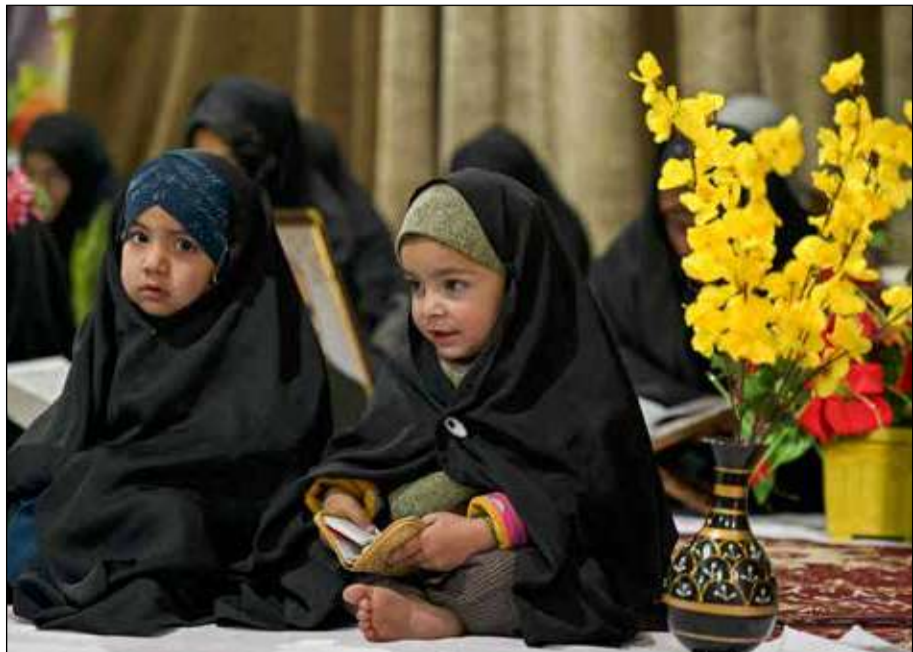
কোরান পাঠে ব্যস্ত খুদেদা। শ্রীনগরের একটি মসজিদে।