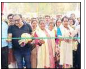
ছাত্রী নিবাসের দারোদঘাটন

স্কুল কর্তৃপক্ষ সূত্রে তার কারণ হিসেবে জানা গিয়েছে, ওই পড়ুয়াদের পরিবারের আর্থিক অবস্থা ভালো না থাকায় তাদের বাড়িভাড়া করে পড়াশোনা চালিয়ে যাওয়ার পরিস্থিতি নেই। তবে এবার নবম থেকে দ্বাদশ শ্রেণি পর্যন্ত পড়ুয়াদের জন্যও তৈরি হল ছাত্রী নিবাস।