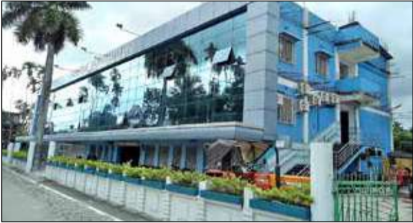
ধূপগুড়ি পুরসভা। - সংবাদচিত্র

ধূপগুড়ি, ২৬ মার্চ : চলতি মাসের গোড়ায় নকল জন্ম শংসাপত্র দেওয়ার অপরাধে ধূপগুড়ি থেকে গ্রেপ্তার করা হয়েছিল একজনকে। তার রেশ কাটতে না কাটতেই বুধবার ফের পুর কর্তৃপক্ষের হাতে আসে আরেকটি নকল জন্ম শংসাপত্র। আর তা নিয়ে বিস্তারিত খোঁজ শুরু করার আগেই চম্পট দেয় শংসাপত্র নিয়ে পুরসভায় হাজার এক মহিলা ও তার সঙ্গী। কোথা থেকে কে এই শংসাপত্র ইস্যু করেছে এনিবে বিস্তারিত তদন্তের নির্দেশ দিয়েছে ধূপগুড়ি পুর প্রশাসক কর্তৃপক্ষ। সেইসঙ্গে একের পর এক নকল জন্ম শংসাপত্র নিয়ে চিন্তায় পড়েছেন পুরকর্তারা।