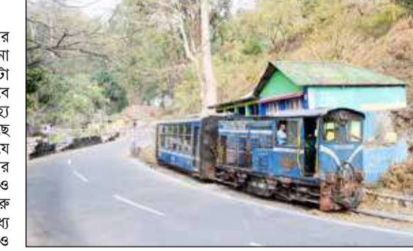
সাদা দিয়ে শুক্রবার থেকে ফের পরিষেবা শুরুর পরিকল্পনা নিয়েছে ডিএইচআর।