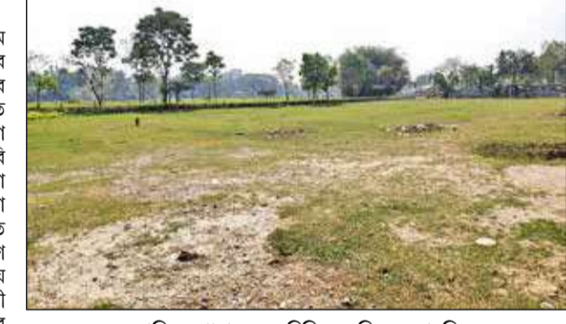
ক্রান্তিতে থানার জন্য চিহ্নিত জমি। - সংবাদচিত্র

ক্রান্তি, ২৬ মার্চ : ছয়টি গ্রাম পঞ্চায়েত নিয়ে গঠিত ক্রান্তি রকের জনসংখ্যা দেড় লক্ষাধিক। বছর তিনেক আগে ক্রান্তি রকে রূপান্তরিত হয়েছে। তবে রক গঠনের বহু আগে থেকে ক্রান্তিতে থানা নিমার্ণের দাবি রয়েছে গ্রামবাসীদের। একদিকে চা বাগান। অন্যদিকে, জঙ্গলে ঘেরা এলাকার মানুষকে পরিষেবা দিতে হিমসিম খেতে হয় ক্রান্তি পুলিশ ফাঁড়িকে। সীমিত সংখ্যক কর্মী দিয়ে ক্রান্তি আউটপোস্টকে মুখোপেক্ষী হয়ে থাকতে হয় মালবাজার থানার ওপর।