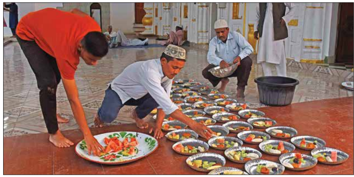
ইফতারের প্রস্তুতি। বুধবার গোমস্তাপাড়ার কালু সাহেবের মাজারে।