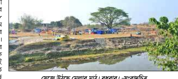
সেজে উঠছে মেলার মাঠ। বুধবার। - সংবাদচিত্র

মানিকগঞ্জ, ২৬ মার্চ : নদী উত্তরবাহী না হলে বারুণীমেলার আয়োজন কার্যত বৃথা। ১৯৬৮ সালের ভয়াবহ বনায় টোলগ্রাম বারুণীমেলা প্রাক্কমে যমুনা নদীর বিভিন্ন অংশে ভাঙন শুরু হয়। এতে উত্তরপ্রান্তে ওই নদী নিজের গতিপথ পরিবর্তন করে পূর্বদিকে প্রবাহিত হতে শুরু করে। এতেই মেলার ঐতিহ্য ক্ষুণ্ণ হয়। বিগত কয়েক বছরে দেখা গিয়েছে পূণ্যান্বনের জন্য মানুষের সমাগমও কমেছে। শুধু মেলার জন্য মানুষের আনাগোনা চোখে পড়ত। তবে এবার ফের সেই পুরোনো ঐতিহ্য ফিরে পেল মালকানির টোলগ্রাম বারুণীমেলা। প্রায় ৮০০ মিটার খাল কেটে যমুনা নদীর গতিপথ পরিবর্তন করে উত্তরদিকে করা হয়। বৃহত্তপ্তিবার থেকে মুগুন করে যমুনা নদীর উত্তরবাহী স্রোতে স্নান করে