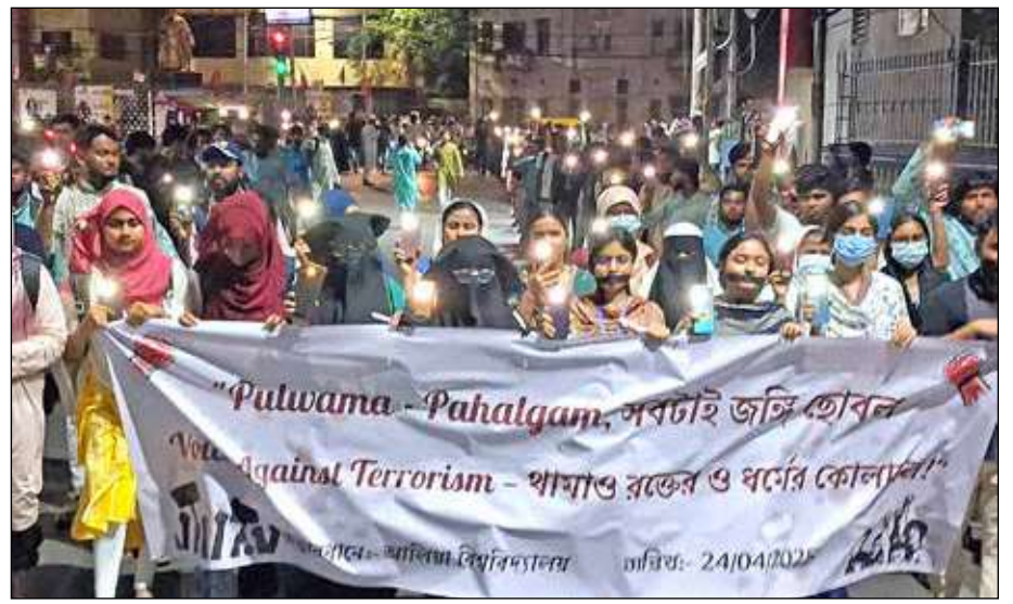
কাশ্মীরে জঙ্গি হামলার প্রতিবাদে আলিয়া বিশ্ববিদ্যালয়ের পড়ুয়াদের মিছিল। বৃহস্পতিবার কলকাতায়।

এর সঙ্গে চাকরিহারা আন্দোলনের মতো আলাদাভাবে ধর্না ও অবস্থানে আন্দোলনের ভবিষ্যৎ প্রশ্নটিহের মুখে