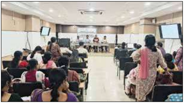
অঙ্গনওয়াড়ি কেন্দ্রের সমস্যা নিয়ে সদর মহকুমা শাসকের বৈঠক।

তাঁরা নিরাপত্তাহীনতায় ভুগছেন। বিষয়টি নিয়ে আগেও তাঁরা প্রতিবাদ জানিয়েছিলেন। এর জেরে ওই ঠেকটি মাঝে কিছুদিন বন্ধ ছিল। দোল পেরিয়ে যাওয়ার পর ঠেকটি ফের চালু হওয়ায় পরিস্থিতি যে-কে-সেই। বৃহস্পতিবার বেশ কয়েকজন মহিলা মিলে থানায় যান। সেখানে পঞ্চায়েত সদস্য বলেন, 'মদের ঠেকের বিরুদ্ধে দলমতনির্ভেদে আমরা একত্রিত হয়েছি। যে বাড়িতে ঠেকটি চলে সেটির সামনেই একটি প্রাইমারি ও একটি হাইস্কুল রয়েছে। স্বামী ও স্ত্রী মিলে ঠেকটি চালায়। বৃহবার আমার প্রতিবাদ জানাতে গেলে ঠেকের অনেকে আমাদের উপর চড়াও হয়। এরপর পুলিশ আসে। সর্বকিছু জানিয়ে আমরা এর আগে জেলা শাসক, পুলিশ সুপার, বিডিও, কোতোয়ালি থানা ও খড়িয়া গ্রাম পঞ্চায়েতের কাছে অভিযোগ জানিয়েছি।'