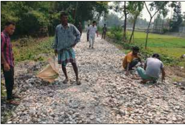
চ্যাংমারি ডব্লিউএমই হাইস্কুল থেকেই জোড়দিঘি পর্যন্ত এই রাস্তার কাজ নিয়ে অভিযোগ উঠছে।