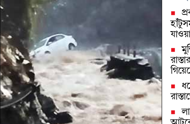
কয়েক ঘণ্টার বৃষ্টিতে বিপর্যস্ত।

প্রবল বর্ষণে পাহাড়ি রাস্তাতেও হাটুসমান জল, গাড়ি ভেসে যাওয়ার উপক্রম মুন্সি থাংয়ে লাচেন-চুংথাংয়ের রাস্তার বড় একটা অংশ ধসে গিয়েছে ধসের জেরে লাচুং-লাচেনের রাস্তাতেও যান চলাচল বন্ধ লাচেনের পাশাপাশি লাচুংয়েও আটকে প্রচুর পর্যটক, বন্ধ পারমিট ইস্যু চলাচল। জানা গিয়েছে, এদিন এতটাই বৃষ্টি হয়েছে যে, কয়েকটি এলাকায় রাস্তা দিয়ে হাটুসমান জল কয়েকটি এলাকায় ধস নেমেছে বলে জানা গিয়েছে। এই রাস্তাগুলিতে সাময়িকভাবে বন্ধ রয়েছে যান