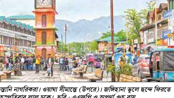
ভারত ছেড়ে দেশে ফিরছেন পাকিস্তানি নাগরিকরা। ওয়াশা সীমান্তে (উপরে)। জঙ্গিহানা ভুলে ছন্দে ফিরতে চাইছে শ্রীনগর। বৃহৎপতিবার লাল চক্রে।