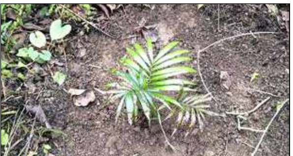
দলগাঁও ফরেস্ট এলাকায় এভাবেই বেত গাছ লাগাচ্ছে বনবিভাগ।

জলপাইগুড়ি, ২৩ এপ্রিল : ডুয়ার্শের বনাঞ্চল থেকে বেত-নলখাগড়ার মতো গাছ এবং সবুজ তৃণভূমি ক্রমশ হারিয়ে যাচ্ছে। ফলে তৃণভোজীদের খাদ্যসংকট দেখা দিচ্ছে। গভ কয়েকবছর ধরে নানা মহল থেকে এমনই আশঙ্কার কথা উঠে আসছে। তাই বেত-নলখাগড়ার চাষ জঙ্গল এলাকায় বাড়ানোর কাজ শুরু করল জলপাইগুড়ি বনবিভাগ।