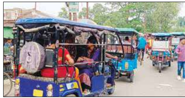
জলপাইগুড়ি শহরের রাস্তায় দাপিয়ে বেড়াচ্ছে নববর্ষবিহীন টোটো।

তবে আইএনটিটিইউসির নেতাদের ওই প্রস্তাব যে ভোটের রাজনীতি সেটা ক্রমশ স্পষ্ট হয়েছে। গ্রামের টোটো শহরে ঢোকা বন্ধ হলে প্রভাব পড়বে সরাসরি ভোট বাস্তব। বিধানসভা ভোটের আগে তৃণমূলের একটা অংশ ওই ব্যাপকে প্রভাব ফেলতে চাইছে না। শাসকবলের অন্দরে ঠাড়া লড়াইয়ে বারবার ভেঙে যাচ্ছে পুরসভার অভিযান বলে মনে করছে রাজনৈতিক মহল।