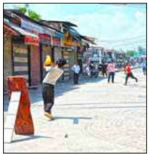
শ্রীনগরের রাস্তায় চলছে ক্রিকেট।

থেকে কাশ্মীর পর্যন্ত গোটা রাস্তা ঘুরে দেখা গেল ওষুধের দোকান এবং খাবারের দোকান ছাড়া খোলা নেই কিছুই। তবে রাস্তায় চোখে পড়েছে শ্রীনগরগামী পর্যটকবোরাই বেশ কিছু যানবাহন এবং সেনা, আধা সেনা