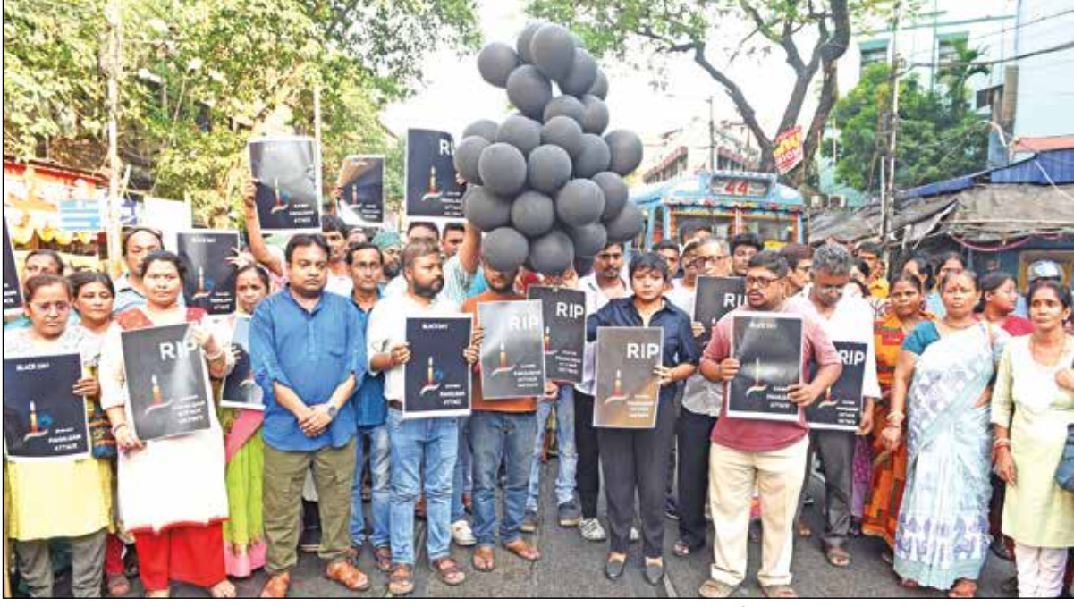
পহলগামে জঙ্গি হামলার প্রতিবাদ শিয়ালদায়। বুধবার।