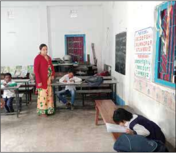
ক্রাস চলছে আদরপাড়া দক্ষিণেশ্বরী প্রাথমিক বিদ্যালয়ে। -সংবাদচিত্র

জলপাইগুড়ি, ১৯ জানুয়ারি : ‘পড়ুয়া চাই, পড়ুয়া’ না শুনে অর্থাৎ অর্থের অভাবে কোথাও ফেরিওয়ালার নয়। বরং চলতি শিক্ষাবর্ষে যাতে ভর্তির সংখ্যা আশানুরূপ হয়, সেজন্য পড়ুয়া টানতে বাড়ি বাড়ি ঘুরে বেড়াচ্ছেন প্রাইমারি স্কুলের শিক্ষকরা। স্কুলে এসে এখন এটাই কাজ হয়ে দাঁড়িয়েছে তাঁদের। জলপাইগুড়ির বেশ কয়েকটি স্কুলের এমন পরিস্থিতিতে কার্যত বিড়ম্বনার বিষয় হয়ে দাঁড়িয়েছে স্কুল কর্তৃপক্ষ সহ উপস্থিত কর্তৃপক্ষের কাছে।