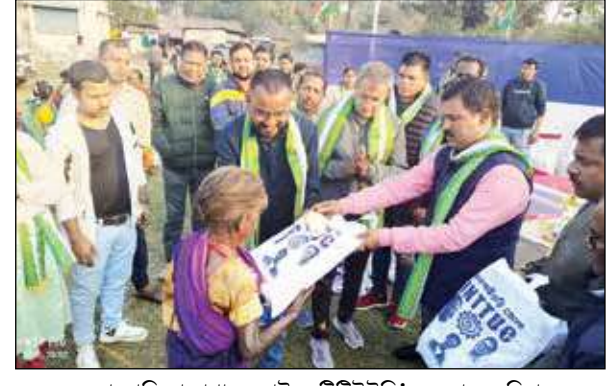
করলাভালি চা বাগানে আইএনটিটিইউসি'র বন্দনাদ। রবিবার।

শ্রমিকরা বুঝতে পেরেছেন। তাই তাঁরা আমাদের স্বীকৃত তৃণমূল ইন্ডাস্ট্রিয়াল এস্টেট ওয়াকার্স ইউনিয়নের সঙ্গে যুক্ত হয়েছেন। এখন শিলাখলে কারও ব্যক্তিগত ইচ্ছায় বা দাদাগিরিতে কোনও কিছু চলবে না।