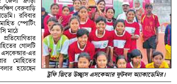
ট্রফি জিতে উল্লাস এসকেআর ফুটবল অ্যাকাডেমির।