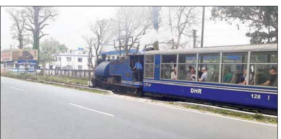
শিলিগুড়ি থেকে দার্জিলিংগামী জাতীয় সড়ক। পাশ দিয়ে ছুটছে টয়ট্রেন।

এক অভিভাবক জানান, স্কুলে এমন ঘটনা কখনও ভাবা যায় না। তিনি বলেন, 'ছেলেকে নিয়ে দুশ্চিন্তা হচ্ছে। প্রিন্সিপাল বিষয়টি গুরুত্ব দিয়ে দেখার আশ্বাস দেওয়ায় আমরা পুলিশের কাছে যাচ্ছি না। অভিযুক্তদের শাস্তি দিক কর্তৃপক্ষ।'