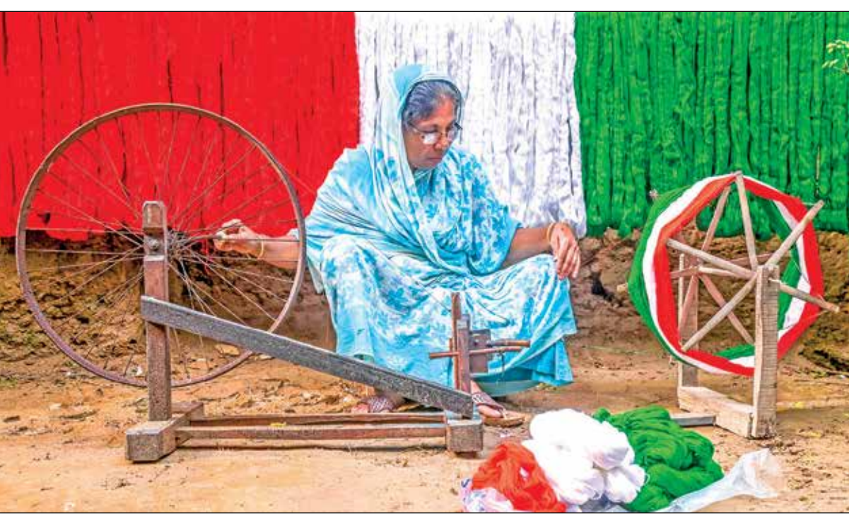
সামনেই প্রজাতন্ত্র দিবস। চলছে তারই প্রস্তুতি। রবিবার নদিয়ায়।

কোন পদ্ধতিতে এগোলে হবে সেই বিষয়গুলি। রাজ্য সম্মেলনের সময় ভোট কৌশল প্রকাশ্যে এনে জনগণের কাছে জানতে চাওয়া হবে। ফেব্রুয়ারিতে এগোলে ভালো হয়। অর্থাৎ জনবিচ্ছিন্নতা কাটাতে জনগণের দরবারে পৌঁছানোর সিদ্ধান্ত নেওয়া হয়েছে। শুধু এই রাজ্যে নয়, দেশের নিরিখেই এই কাজ চলবে।