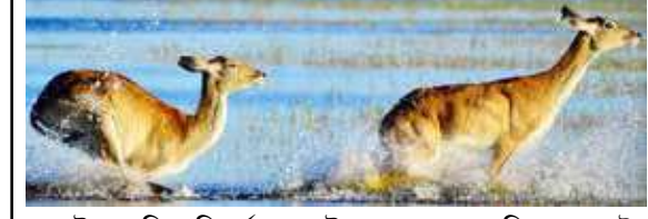
ওয়াইল্ড আফ্রিকা রিভার্স অফ লাইফ দুপুর ২.১৭ অ্যানিমাল প্ল্যান্টে