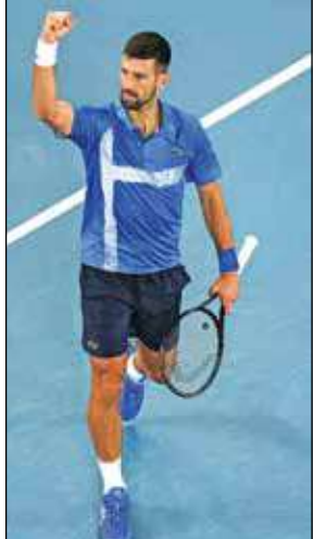
কোয়ার্টার ফাইনালে ওঠার পর সেলিব্রেশন নোভাক জকোভিচের।

মেলবোর্ন, ১৯ জানুয়ারি : অঘটন না ঘটলে অস্ট্রেলিয়ান ওপেনের কোয়ার্টার ফাইনালেই যে নোভাক জকোভিচ-কালোস আলকারাজ গাফিয়ার দ্বৈরথ দেখা যাবে তা জানাই ছিল। চতুর্থ রাউন্ডে সহজ জয় সেটাই নিশ্চিত করে ফেললেন দুই তারকা। জকোভিচ জিতলেন সেট সেটে। আলকারাজ ওয়াকওভার পেলেন। রবিবার জেকার সেট সেটে হারানো চেক প্রজাতন্ত্রের জিরি লেহেকাকে। ম্যাচের ফল ৬-৩, ৬-৪, ৭-৬ (৭/৪)। প্রথম দুই সেট সহজে জিতলেও তৃতীয় সেটটি জিততে টাইব্রেকার পর্যন্ত অপেক্ষা করতে হয় ২৪টি গ্র্যান্ড স্ল্যামের মালিককে। এদিন জয়ের সঙ্গে সঙ্গে রজার ফেডেরারের আরও একটি নজির খুঁজে ফেললেন নোভাক। দুইজনেই ১৫ বার হার্ডকোর্টে গ্র্যান্ড স্ল্যামের কোয়ার্টার ফাইনালে উঠলেন। ২ ঘণ্টা ৩৯ মিনিটে জয় পাওয়ার পর অবশ্য কোর্টে দাঁড়িয়ে থাকা প্রাক্তন আমেরিকান টেনিস তারকা জিম কুরিয়াকে সাফাফকার দিতে অস্বীকার করেন জকোভিচ। তিনি শুধু দর্শকদের ধন্যবাদ দিয়েই কোর্ট ছাড়েন। তবে রড লেভার এরিনার টানেল দিয়ে বেরোনোর সময় ভক্তদের এগিয়ে দেওয়া ম্যাচ বল, টি-শার্টে অপ্রোথ্য দিতে দেখা যায় নোভাককে। পরে অবশ্য