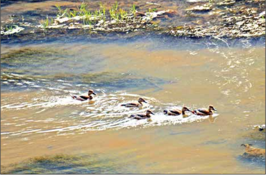
চরবেতি চরবেতি... রবিবার করলা নদীতে হাঁসদের ছবি তুলেছেন মানসী দেব সরকার।