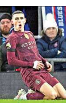
জোড়া গোল পেলেন ফিল ফোডেন।

লন্ডন, ১৯ জানুয়ারি : ইংলিশ প্রিমিয়ার লিগে রবিবার খরের মাঠে ব্রাইটনের কাছে ৩-১ গোলে বিধ্বস্ত হল ম্যাঞ্চেস্টার ইউনাইটেড। ৫ মিনিটে ইয়ানকুবুর গোলে এগিয়ে যায় ব্রাইটন। ২৩ মিনিটে পেনাল্টি থেকে লাল ম্যাঞ্চেস্টারকে সমতায় ফেরান ক্রুনা ফানাভেজ। দ্বিতীয়ার্ধে কাউরু মিডামা ও জিওর্জিনিও রুটার গোল করে ব্রাইটনের জয় নিশ্চিত করেন। এই ম্যাচ হেরে ২২ ম্যাচে ২৬ পয়েন্ট নিয়ে ১৩ নম্বরে রইল রুবেন আম্যোরিমের ছেলেরা।