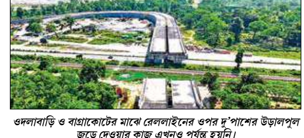
ওদলাবাড়ি ও বাথাকোটের মাঝে রেললাইনের ওপর দু'পাশের উড়ালপুল জুড়ে দেওয়ার কাজ এখনও পর্যন্ত হয়নি।