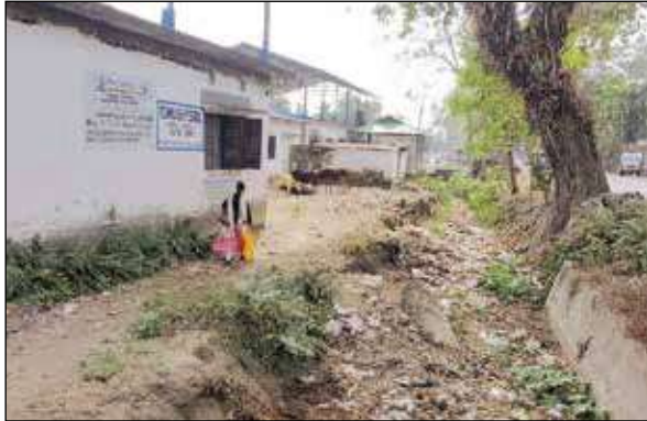
এভাবেই পড়ে রয়েছে তেঁশিমলা বিএফপি স্কুল।

এখন দেখার বিষয়, এই প্রাইমারি বিদ্যালয়গুলোর ভবিষ্যৎ কোন দিকে এগোয়। পড়ুয়ার সংখ্যা দিনে দিনে কমতে থাকায় চিন্তায় শিক্ষক-শিক্ষিকারা।