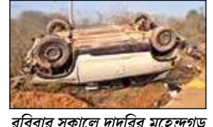
রবিবার সকালে দাদরির মহেশ্রগড় বাইপাসে মনুর মামা ও দিদার স্কুটি চাপা পড়ে এই গাড়ির তলায়।

হরিয়ানা, ১৯ জানুয়ারি : প্যারিস অলিম্পিকে জোড়া পদকজয়ী মনু ভাকেরের পরিবারে দুঃসংবাদ। রবিবার সকালে এক মর্মান্তিক পথ দুর্ঘটনায় প্রাণ হারালেন তারকা শুটারের দিদা ও মামা। হরিয়ানা পুলিশ সূত্রে জানা গিয়েছে, রবিবার সকালে দাদরির মহেশ্রগড় বাইপাসের ওপর দুর্ঘটনাটি ঘটে। মনুর মামা ও দিদা