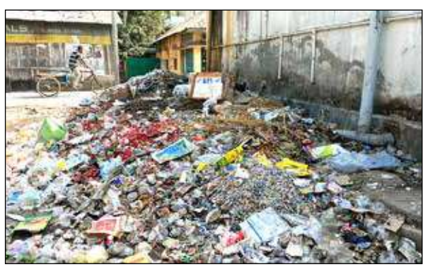
নতুন বাজার মার্কেট কমপ্লেক্সের ভেতরে জমিয়ে রাখা হয়েছে আবর্জনা।

বাণীব্রত চক্রবর্তী ময়নাগুড়ি, ১৯ জানুয়ারি : ময়নাগুড়ি শহরের নতুন বাজার মার্কেট কমপ্লেক্সের ভেতরে আবর্জনা জমিয়ে রাখা হয়েছে। সেখান থেকে দুর্গন্ধ ও দূষণ ছড়িয়ে পড়ছে। ফলে আশপাশের ব্যবসায়ীদের দোকানে বসে থাকা দুষ্কর হয়ে উঠেছে। এখান থেকে মাঝেমধ্যে পুরসভার তরফে আবর্জনা তোলা হলেও ওই জায়গায় আবর্জনা থেকেই যায়, যা থেকে দুর্গন্ধ ছড়িয়ে পড়ে।