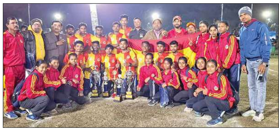
চ্যাম্পিয়ন হওয়ার পর ইন্সটবেঙ্গলের পুরুষ ও মহিলা দল। শিলিগুড়ি কলেজ মাঠে রবিবার।