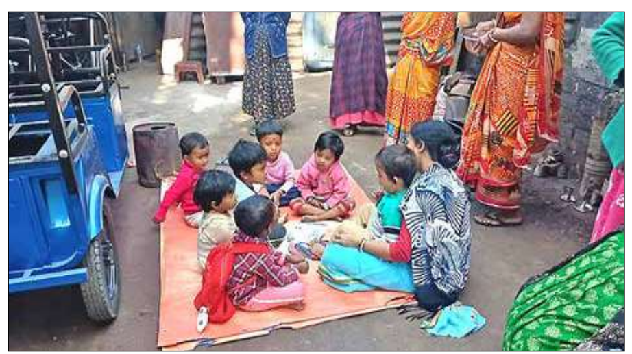
খোলা আকাশের নীচে অল্প পরিসরে চলছে পঠনপাঠন।