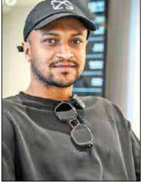
কার্যত্পিতে নাম জড়ায় বাংলাদেশের কিংবদন্তি অলরাউন্ডারের। ১৯ জানুয়ারির মধ্যে আদালতে হাজির নির্দেশ দেওয়া হয়। সেই চূড়ান্ত সমসীয়া পেরোনার পর গ্রেপ্তারি পরোয়ানা। দেশে ফিরলেই গ্রেপ্তার করা হবে সাকিবকে।

ঢাকা, ১৯ জানুয়ারি : খারাপ সময় কাটছে না সাকিব আল হাসানের। বোলিং অ্যাকশন নিয়ে আইসিসি-র কোপে পড়েছেন। জাগাগ হয়নি চ্যাম্পিয়ন্স ট্রফির দলে। বাইশ গজের বিড়ম্বনার পাশাপাশি এবার আইনি ঝামেলা। সাকিবের বিরুদ্ধে গ্রেপ্তারি পরোয়ানা জারি করল ঢাকা আদালত। আর্থিক কার্যত্পির অভিযোগ। আইএফআইসি ব্যাংকের থেকে নিজের সংস্থার জন্য বিশাল অঙ্কের অর্থ ধার নিয়েছিলেন সাকিব। যা শোধ করতে দুটি চেকও জমা দেন। কিন্তু টাকা তুলতে গিয়ে চেক বাউন্স হয় অ্যাকাউন্টে পর্যাপ্ত অর্থ না থাকার কারণে। এরপরই ব্যাংকের তরফে অভিযোগ করা হয় সাকিব এবং তাঁর সংস্থার নামে। ছাত্র আদালত, পালাবাদলের পর থেকে দেশের বাইরে সাকিব- এর মধ্যে গত ১৫ ডিসেম্বর চেক-