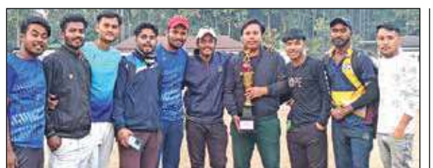
ট্রফি নিয়ে ধূপঝারা আইকনিক একাদশের ক্রিকেটাররা।