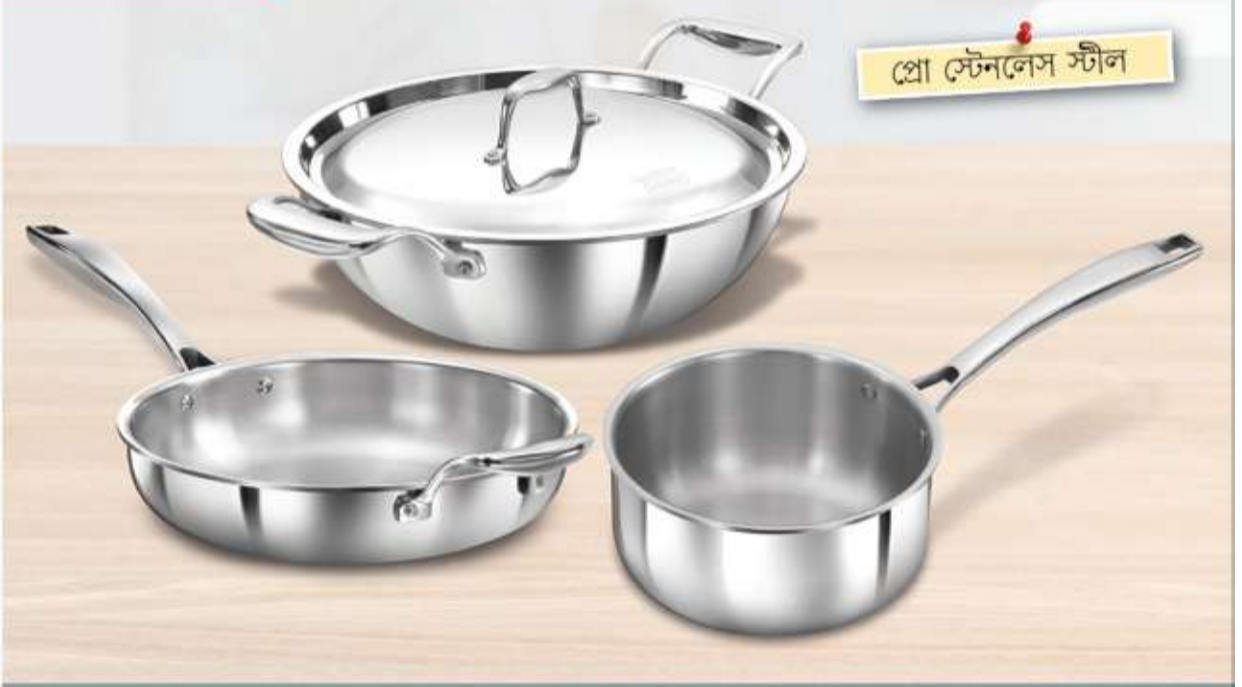
প্রো স্টেনলেস স্টীল

• PTFE নেই, PFAS-ও নেই, নেই কোনো ভারী ধাতু • কম তেলে আরো স্বাস্থ্যকর রান্না • রাঁধুন আর পরিবেশন করুন নিজস্ব স্টাইলে • দাগরোধক, অনায়াসেই পরিষ্কার করা যায়