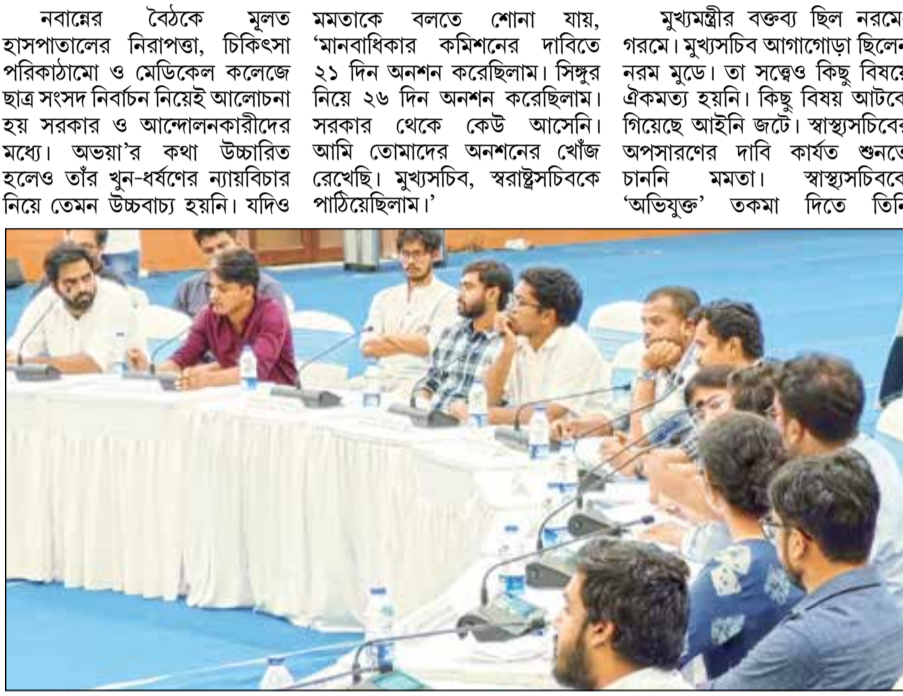
নবাবে মুখ্যমন্ত্রীর সঙ্গে বৈঠকে আন্দোলনকারী জুনিয়ার ডাক্তাররা। সোমবার।

৬৬ মানবাধিকার কমিশনের দাবিতে ২১ দিন অনশন করেছিলাম। সিন্ধুর নিয়ে ২৬ দিন অনশন করেছিলাম। সরকার থেকে কেউ আসেনি। আমি তোমাদের অনশনের খোঁজ রেখেছি। মুখ্যসচিব, স্বরাষ্ট্রসচিবকে পাঠিয়েছিলাম। -মমতা বন্দ্যোপাধ্যায়