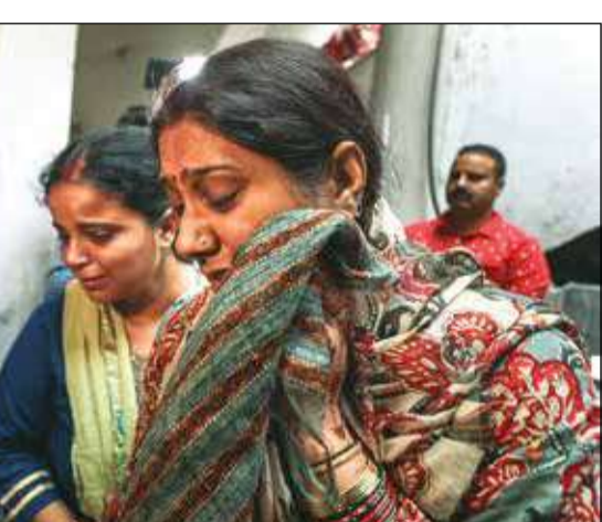
রিবিবার জঙ্গি হাতে নিহত স্বামীর দেহ পেয়ে কামা স্ত্রীর। জন্মুতে।

নয়াদিল্লি, ২১ অক্টোবর :বিদেশে ঘটি গেড়ে থাকা খালিস্তানপন্থী জঙ্গিরা যে ভারতের উড়ান শিরে অস্ত্রধারণ সৃষ্টি করতে চাইছে, সেই ইস্তিত কক্ষ জোরালো হচ্ছে। গত একসপ্তাহে শতাধিক নতুন সংযোজন ১ থেকে ১৯ নভেম্বর পর্যন্ত এয়ার ইন্ডিয়ায় বিমানো না চড়তে বাতীর্পেরে ঈশিয়ারি।