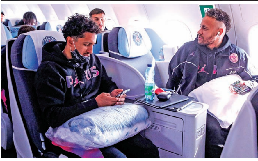
সেমিফাইনালের দ্বিতীয় লেগ খেলতে ম্যাঞ্চেস্টারের পক্ষে নেইমার, কিলিয়ান এম্বাপেরা।

আত্মবিশ্বাসী হলেও টমাস টুডেল ব্রিগেডকে একেবারেই হালকাভাবে নিচ্ছেন না গুয়ার্দিওলা। তাঁর কথায়, 'প্যারিসে দ্বিতীয়ার্বে আমরা যে ফুটবল খেলেছি সেটা এতিহাদ স্টেডিয়ামে পুরো ৯০ মিনিট নেইমাররা আমাদের খেলতে দেবে সেটা একেবারেই আশা করছি না। প্যারিস অত্যন্ত কঠিন প্রতিপক্ষ। কিন্তু আমাদের কাছে দুটো আওয়াজে গোলার আয়ডাভেজ রয়েছে। ফলে কিছুটা এগিয়ে আছি বলতে পারেনা। এখন বাকীটা হেলেরদের হাতে। ওরা যদি চান