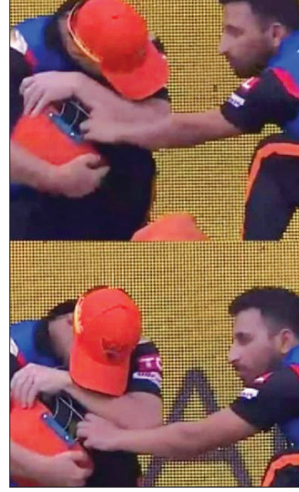
রাজস্থান রয়ালসের বিরুদ্ধে বাদ পড়ায় কতটা ভেঙে পড়ছেন, ডেভিড ওয়ার্নারকে দেখে তা স্পষ্ট।