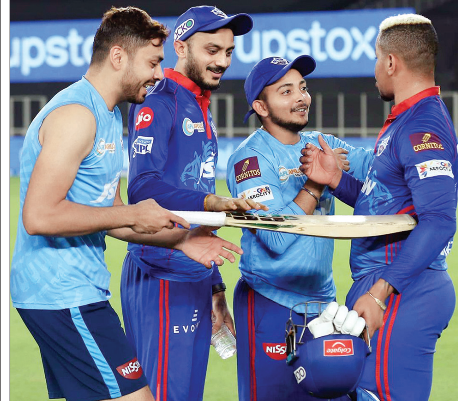
ম্যাচ শেষে খুনশুটি পৃথী, অক্ষর, হেটমেয়ারদের।

ওয়ার্নার না থাকলে নিঃসন্দেহে আডভাটেজ জসপ্রীত বুঝরাহ-ট্রেট বোল্টদের। হায়দরাবাদ ব্যাটিং এমনিতেই ধুকছে। রাজস্থানের বিরুদ্ধে রবিবার সহজ পিচেও চূড়ান্ত বার্থে জেরবার দল। দ্বিতীয় নায়ক ঋজুমান সাহার জাগা আপাতত ডাগআউটে।