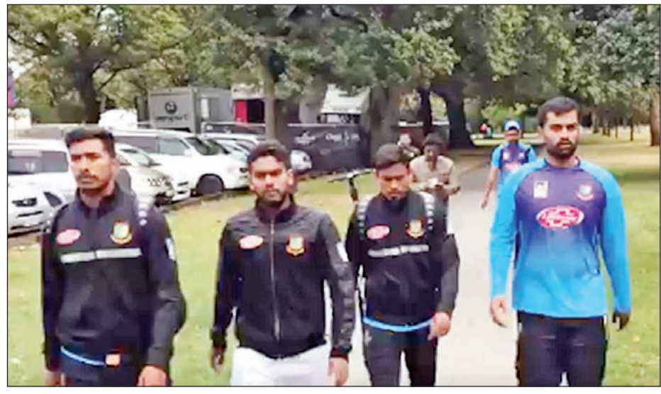
ঘটনাস্থল থেকে নিরাপদ জায়গার দিকে তামিম ইকবাল সহ বাংলাদেশের অন্য ক্রিকেটাররা।

ক্রাইস্টচার্চ, ১৫ মার্চ : পরিকল্পনা ছিল, মসজিদে প্রার্থনা সেরে অনুশীলনের পথ ধরা হবে। কিন্তু জঙ্গিহামলার মুখে পড়ে নিজেদের প্রাণে বেঁচে ফেরার প্রার্থনা করতে করতে বাসের মেঝেতে শুয়ে পড়তে হয়েছিল তামিম ইকবাল, মুশফিকুর রহিমদের। কয়েকটা মিনিট আগে আল নূর মসজিদে পৌঁছে গেলে হয়তো প্রাণে বেঁচে ফিরত না প্রায় গোটা বাংলাদেশ ক্রিকেট দল।