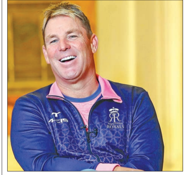
নয়া দিল্লিতে রাজস্থান রয়্যালসের ব্র্যান্ড অ্যান্ডারসন শেন ওয়ার্ন।

নিউজিল্যান্ডে গণহত্যার খবরে ব্যথিত। সমবেদনা বিপন্ন পরিবারদের জন্য। বাংলাদেশের ক্রিকেটাররা সুরক্ষিত, শুনে স্বস্তি পেলাম।