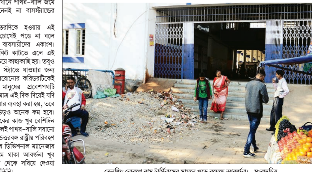
তেনজিং নোরগে বাস টার্মিনাসের সামনে পড়ে রয়েছে আবর্জনা।

শিলিগুড়ি, ১০ জানুয়ারি : তেনজিং নোরগে বাস টার্মিনাসের গেটের সামনে জমে রয়েছে পাথর-বালির স্তুপ। গেটের পাশে সেপটিক ট্যাংক সারাইয়ের কাজ শেষ হয়ে গেলেও জমে থাকা পাথর-বালি গেটের সামনে থেকে সরানো হয়নি। পথদলতি মানুষ সেই পাথরের স্তুপটিকেই ঘোরা ফেলার জায়গা হিসেবে ব্যবহার করে চলেছেন বলে অভিযোগ স্থানীয় ব্যবসায়ীদের। বাস টার্মিনাসের গেটের বাইরে জমে থাকা পাথর, বালি ও আবর্জনা পরিষ্কার করার কোনো উদ্যোগ না নেওয়ায় ব্যবসায়ীদেরই তা পরিষ্কার করতে হচ্ছে বলেও অভিযোগ করেন তারা। এই গেটটি উত্তরবঙ্গ বাস্তু পরিবহন নিগমের বাসস্ট্যান্ডের দিকটিতে কোকার প্রধান প্রবেশপথ। ফলে এটি বালি-পাথর এখান থেকে কেটে সরানো হবে তা নিয়ে প্রশ্ন তুলেছেন স্থানীয় ব্যবসায়ীদের একাংশ।