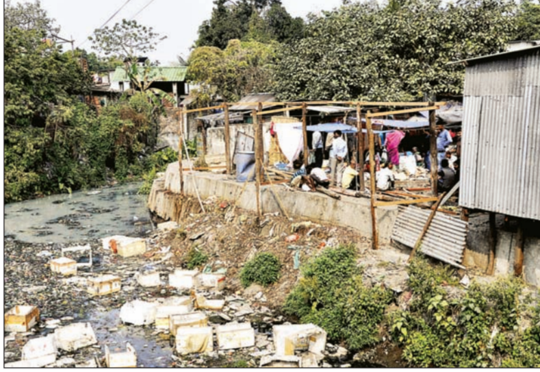
যোগামালি সেতু সংলগ্ন যোগামালি নেতাজি বাজারে গার্ডওয়াল তৈরির সময় পুরনিগমের উদ্যোগে আটটি দোকান ভেঙে দেওয়া হয়। যদিও বৃহস্পতিবার যোগামালি ব্রিজের সামনে যেতেই গার্ডওয়াল দখল করে বাজারের ওই অংশে কয়েকজনকে কার্টের কাঠামো বসিয়ে দোকান তৈরি করতে দেখা গেল।