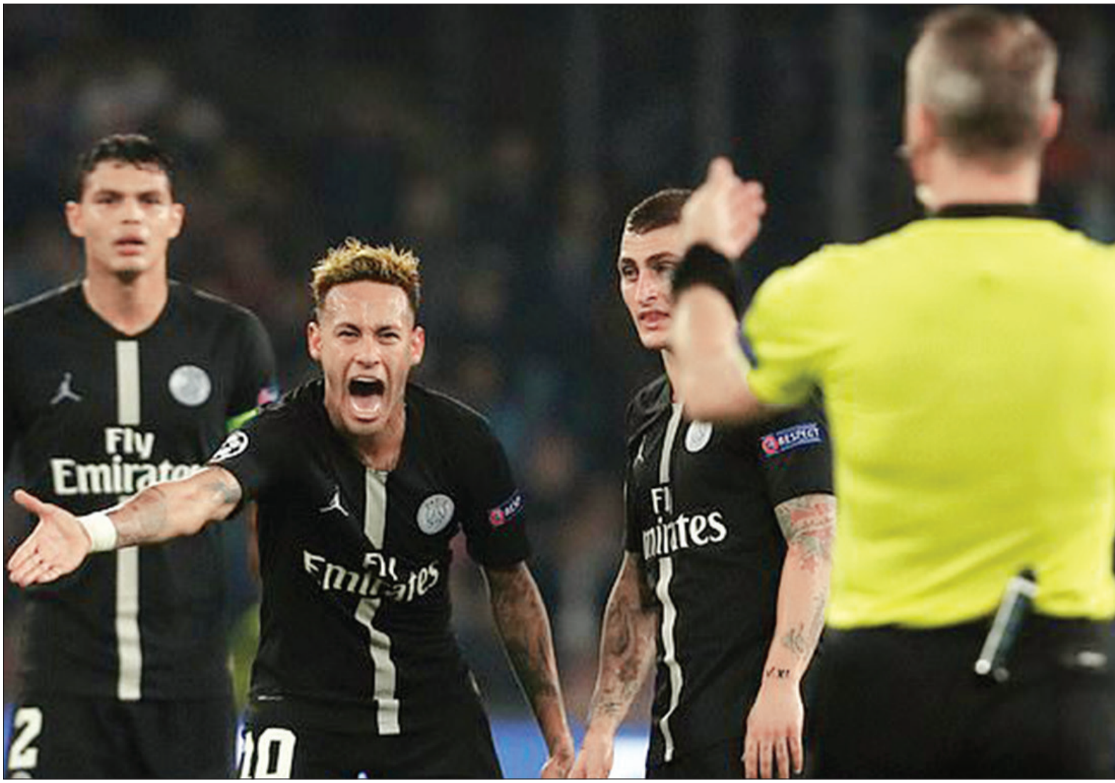
রেফারির সিদ্ধান্তে ফ্রুক নেইমার।