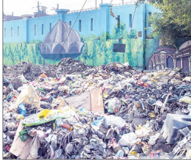
সাফাইকর্মীদের কর্মবিহীনতার জেরে আবর্জনার স্তুপ দিল্লিতে।

রাফায়েল চুক্তি নিয়ে গোড়া থেকেই সরব রাহুল গান্ধি। ৩৬টি বিমান কোনার পিছনে বড়োঅর্থমন্ত্রী চুক্তি হয়েছে বলে অভিযোগ করেছেন তিনি। রাষ্ট্রায়ত্ত্ব হ্যালকে বাগ দিয়ে শিল্পপতি অনিল আস্থানির রিলায়েস ডিফেন্সকে রাফায়েল তৈরির ব্যরাত দেওয়ার পিছনে দুর্নীতি হয়েছে বলে অভিযোগ করেন রাহুল। সম্প্রতি প্রাক্তন ফরাসি প্রেসিডেন্ট ফ্রান্সোয়া ওল্দাঁকে ফ্রান্সের একটি সংবাদমাধ্যমকে জানান, ভারতের তত্ত্বয়ে শুধু আস্থানির সংস্থার নামই প্রস্তাব করা হয়েছিল। তাতে রাজি হওয়া ছাড়া তাঁদের কাছে আর কোনো উপায় ছিল না। ওল্দাঁদের এই মন্তব্যের জেরে প্রধানমন্ত্রীকে চোর বলেও কাটাক করেছেন রাহুল। পাঁচ বাজোর আসন্ন বিধানসভা ভোট এবং আগামী বছর লোকসভা ভোটে রাফায়েলকে হুট্টু করে কংগ্রেস কংগ্রেসের পাশাপাশি রাফায়েল নিয়ে যৌথ সংসদীয় তদন্তেরও দাবি জানিয়েছে অন্যান্য বিরোধী দল।