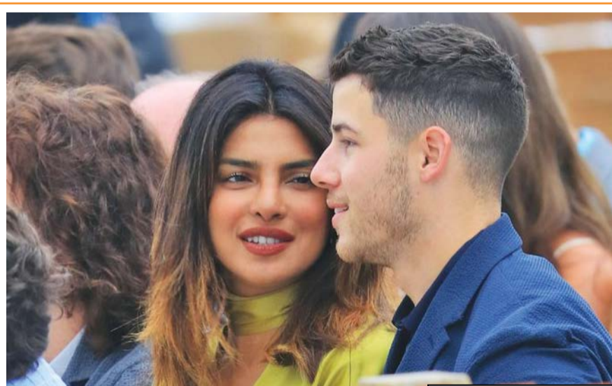
প্রিয়াংকা চোপড়া নিক জেনস্ কাঞ্জিনের বিয়েতে...