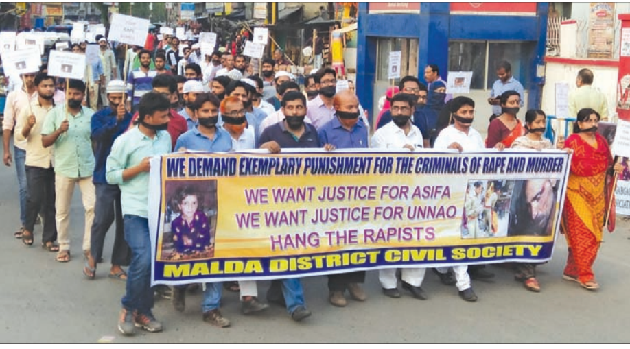
ধর্ষকদের শাস্তির দাবিতে মালদা শহরে মিছিল। -সংবাদচিত্র

অভিযুক্তদের বাড়ির ঠিকানায় পাঠানো হবে বলে জানান দেবজিত। দেবজিত বলে বলেন, অত্যন্ত বেদনাদায়ক ঘটনা হয়েছে কাশ্মীরে। অথচ একদল মানুষ ধর্ষকদের সমর্থনে ভারতের পতাকা ব্যবহার করে পশ্চিমবঙ্গের দেবজিতের বাড়িতে আড়াল করার চেষ্টা চলছে। তাই আইনের ওপর ভরসা নিয়ে আমরা আসি। এই ধর্ষক ও খুনিদের জুতো মারা দরকার। তাই প্রতীকী জুতো মারা দেওয়ার উদ্যোগে পাঠানো হবে বলে জানান দেবজিত।