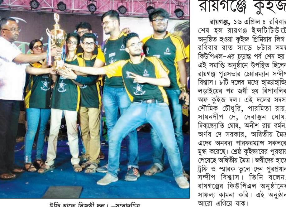
ট্রফি হাতে বিজয়ী দল। -সংবাদচিত্র