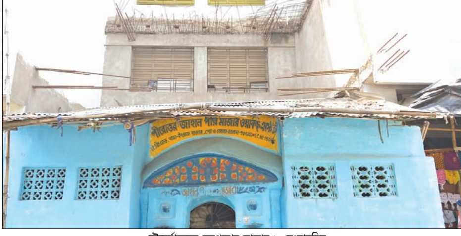
সৌন্দর্যায়নের অপেক্ষায় মাজার। -সংবাদচিত্র

আমর গণনা করে প্রতিবাদের খবর শুনে পড়ল মালদা ও বালুরঘাটে। সোমবার বিকালে মালদা শহরে বৃদ্ধিজীবীদের সংগঠন মালদা জেলা সিন্ডিক্যাল সোসাইটির আহ্বানে বের হওয়া মৌন মিছিল বের হয়। একই দিনে বালুরঘাট শহরে ফেসবুক কাণ্ডে প্রতিবাদী দোস্তের উদ্যোগে একটি কর্মসূচি নেওয়া হয়েছে। যে কর্মসূচিতে রয়েছে পরিভ্রম জুতো, চপ্পল সন্ত হস্ত। আমরা চাই ধর্ষকদের পাঠানো হবে অভিযুক্তদের বাড়িতে।