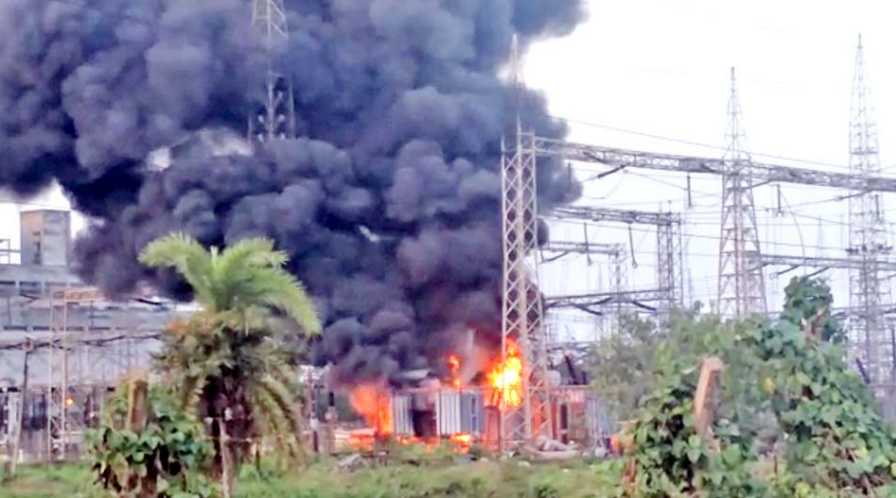
সোমবার সন্ধ্যায় কোলাঘাট তাপবিদ্যুৎ কেন্দ্রে ভয়াবহ অগ্নিকাণ্ডে চাঞ্চল্য ছড়ায়। স্থানীয়রাই প্রথম ট্রাকফরমারে আঙুন দেখতে পেয়ে দমকলে খবর দেন। দমকলের হুট ইঞ্জিন দুই ঘণ্টার ভেতরে আঙুন নিয়ন্ত্রণে আনে। দমকলের প্রাথমিক অনুমান, শর্ট সার্কিটের জেরে এই ঘটনা।