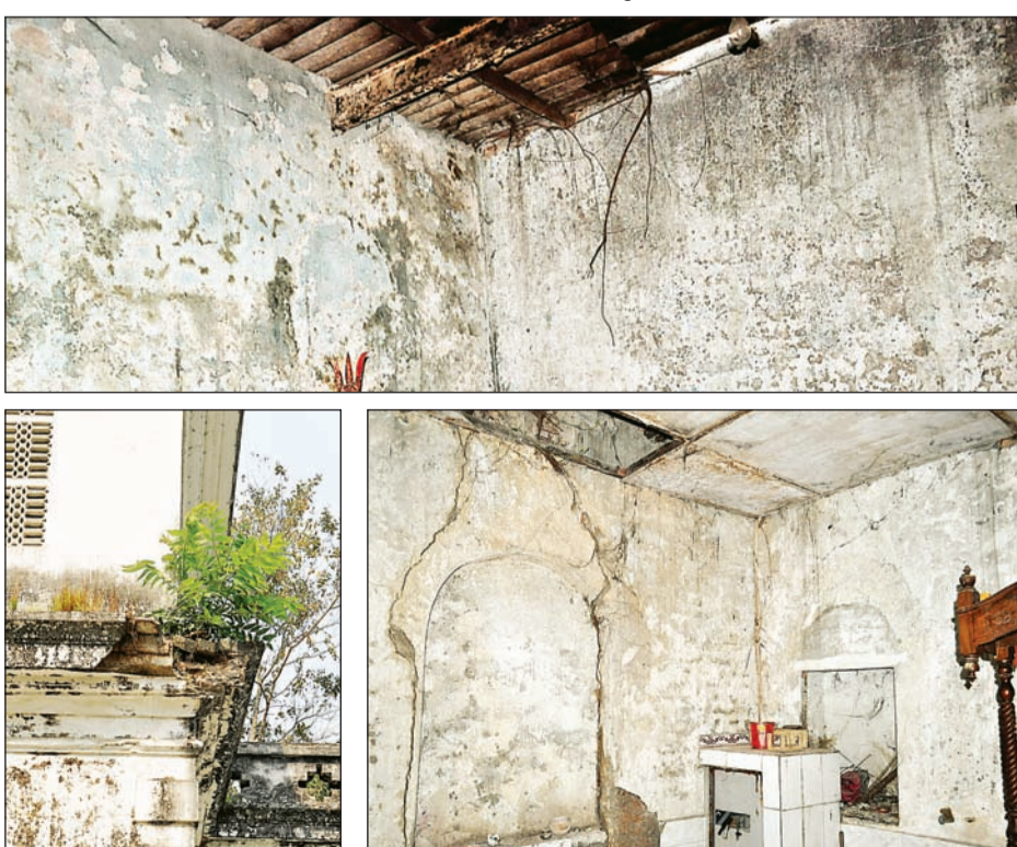
ডাঙ্গরাই মন্দিরের বেহাল দশা। কোথাও কানিশে গজিয়েছে গাছ, কোথাও দেয়ালে খরচে ফাটল।