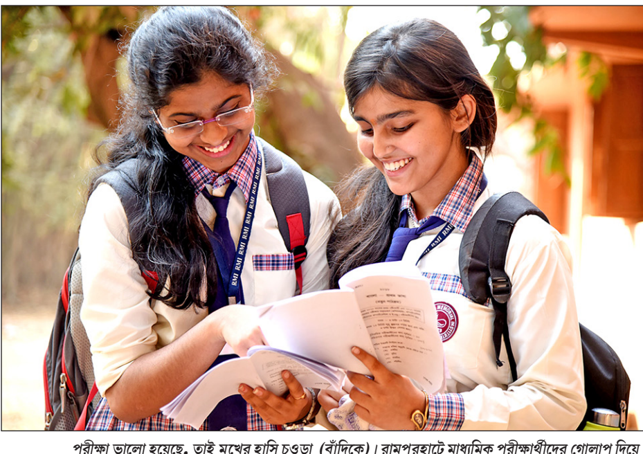
পরীক্ষা ভালো হয়েছে, তাই মুখের হাসি চওড়া (বাঁপিকে)। রামপুরহাটে মাধ্যমিক পরীক্ষার্থীদের গোলাপ দিয়ে শুভেচ্ছা জানাচ্ছেন এসডিপিও।

১০ মার্চ সিবিএসই-র তরফে জানানো হয়, মেডিকেল কাউন্সিল অফ ইন্ডিয়া আন্ট সংশোধন করে এমসিআই নতুন নিয়ম চালু করেছে। নতুন নিয়মে বলা হয়েছে, বিদেশের কোনো প্রতিষ্ঠানে ডাক্তারি পড়তে হলেও এবার থেকে প্রার্থীদের নিট-এ বসতেই হবে। এ বছর ৬ মে নিট-এর দিন স্থির হয়েছে। ওই পরীক্ষায় বসার জন্য আবেদনপত্র