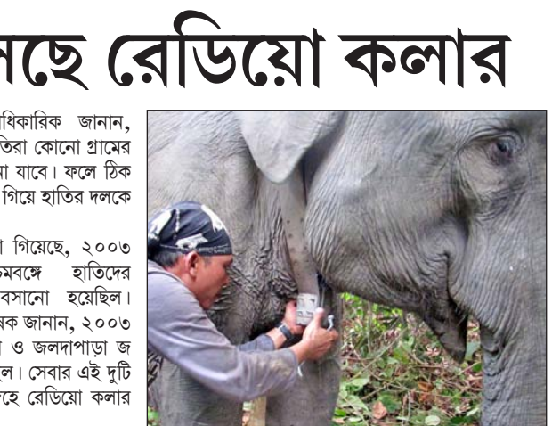
তিনি। এক প্রবীণ বন্যপ্রাণিকারক জানান, রেডিয়ো কলার সংযুক্ত হাতিরা কোনো গ্রামের দিকে এগোলেই সেটা জানা যাবে। ফলে ঠিক সময়ে বনকর্মীরা ওই গ্রামে গিয়ে হাতির দলকে তাড়তে পারবে।

নিজস্ব প্রতিনিধি, কলকাতা, ১২ মার্চ : রাজ্য সরকার ৬৯টি মহিলা কলেজে স্যানিটারি ন্যাপকিনের মেশিন বসানোর সিদ্ধান্ত নিয়েছে। এর জন্য শিক্ষা দপ্তর ৪৫ লক্ষের বেশি টাকা বরাদ্দ করেছে বলে সরকারি সূত্রে খবর। ছাত্রীদের স্বাস্থ্য ও পরিচ্ছন্নতাবোধ বাড়ানোই এর উদ্দেশ্য। মহিলা কলেজগুলি এই প্রকল্পের আওতায় আসবে। এর মধ্যে ডায়মন্ড হারবার মহিলা বিশ্ববিদ্যালয়ও আছে। কলকাতায় আছে ৩০টি মহিলা কলেজ। এর জন্য কলেজ পিছু প্রায় ৬৬ হাজার টাকা খরচ হবে।