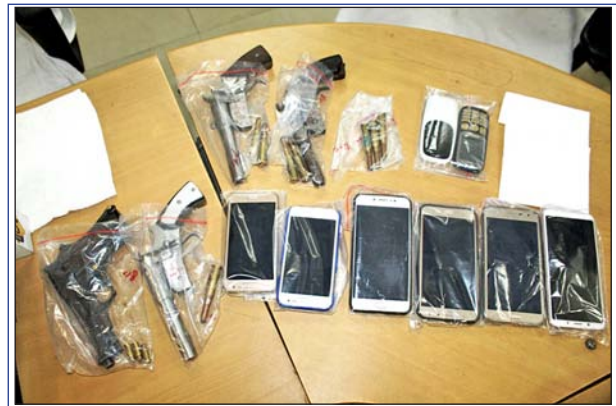
উজার হওয়া কার্তুজ, পিস্তল ও মোবাইল