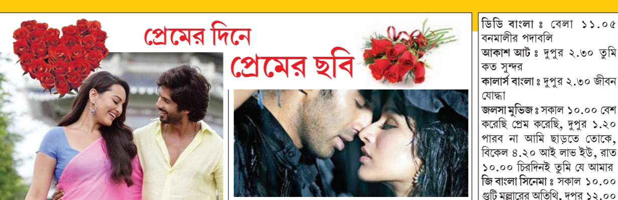
আর... রাজকুমার বিকেল ৫.২৫ ইউটিভি মুভিজে

ডিডি বাংলাঃ সকাল ৭.০০ সকাল সকাল, ৯.০০ প্রধানমন্ত্রী আবাস যোজনা, দুপুর ২.০০ সংবাদ, ২.৩০ আজকের রান্না, বিকেল ৩.০০ পরীক্ষা স্পেশাল, ৪.০০ মন নিয়ে, ৫.০৫ ছায়াছবি গান, ৫.৩০ কৃষি দর্শন, সন্ধ্যা ৬.৩০ প্রযুক্তি তত্ত্বা, ৭.৩০ যুক্তি তত্ত্বা, রাত ৯.০৫ গান অন্তহীন, ১১.০০ অর্থনীতির দুনিয়া