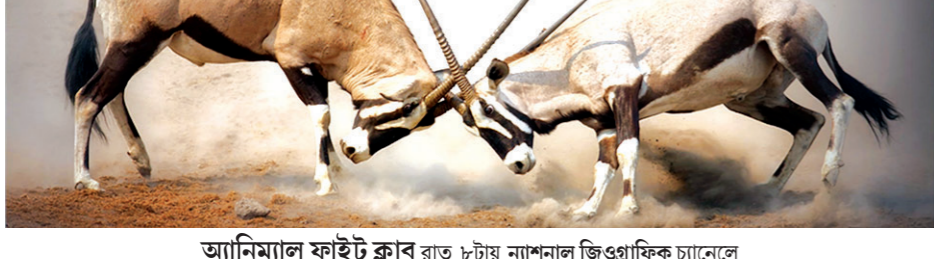
অ্যানিম্যাল ফাইট ক্লাব রাত ৮টায় ন্যাশনাল জিওগ্রাফিক চ্যানেলে

প্রেমের দিনে প্রেমের ছবি আর্শিকি টু বিকেল ৩টায় সোনি ম্যাঞ্জে