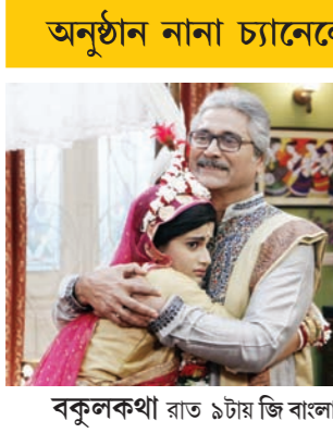
বকুলকথা রাত ৯টায় জি বাংলায়