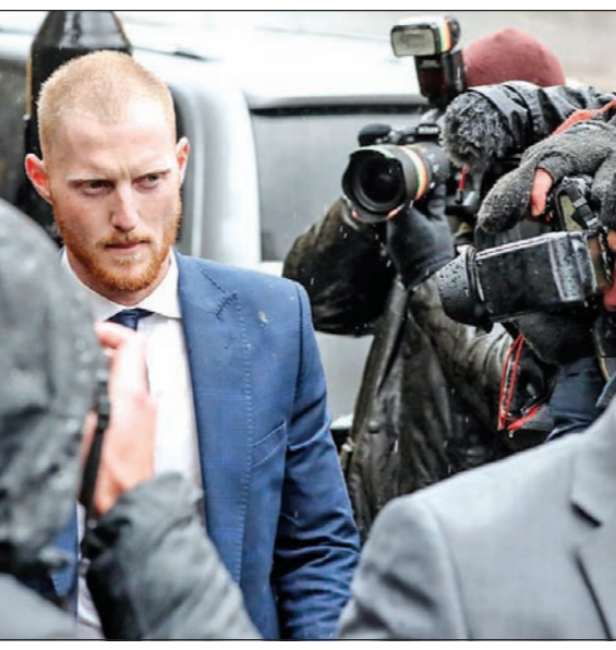
ব্রিস্টলের ম্যাঞ্জিস্ট্রেট কোর্টে হুকছেন বেন স্টোকস।

ক্রিকেট থেকে নির্বাসিত করে ইসিবি। ব্রিস্টল কাপে দোষী প্রমাণিত হলে স্টোকসের ছয় মাস থেকে তিন বছর পর্যন্ত জেল হাজির হতে পারে। স্টোকসের সঙ্গে সেরদার ঘনানুসে ছিলেন ইংল্যান্ডের আর এক ক্রিকেটার আলেক্স হেলসও। যদিও তার বিরুদ্ধে কোনো চার্জ গঠন করেনি পুলিশ। ব্রিস্টল কাপের পর ইংল্যান্ডের জাতীয় দলে স্টোকসকে খেলতে না দেখা গেলেও নিউজিল্যান্ডের ধারোয়া ক্রিকেট কাউন্সিলের ক্রিসের হয়ে অংশ নিতে দেখা গিয়েছে ২৬ বছরের এই অলরাউন্ডারকে। একদশতম আইপিএলে রাজস্থান রয়্যালসের হয়ে খেলতে দেখা যাবে বেন স্টোকসকে।