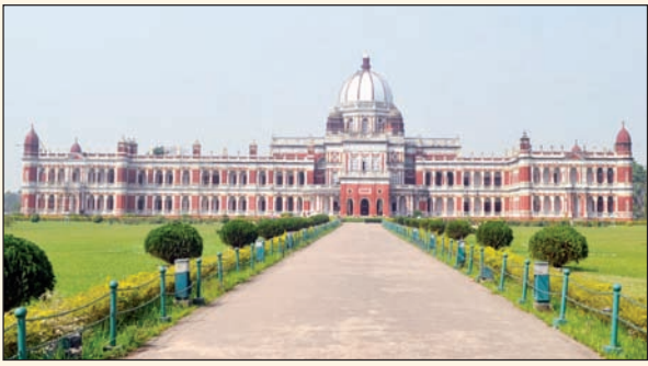
কোচবিহারের ঐতিহাসিক ঘটনা ও ঐতিহ্যবাহী লোকসংস্কৃতি তথা কোচবিহারের ইতিহাসকে শুধুমাত্র বাংলা ভাষাভাষী মানুষের গণ্ডির মধ্যে না রেখে তা দেশ-বিদেশের মানুষের কাছে পৌঁছে দেওয়া দরকার।

ইতিহাস। কোচবিহার জেলার প্রাচীন দেবালয়গুলির কথাও মানুষ জানতে পারেননি। ইংরেজি ভাষায় বই পাওয়া গেলে তিনিও কোচবিহারের অনেক তথ্য জানতে পারতেন। কিন্তু তা হল না। জেলাশাসক বলেন, কোচবিহারের ইতিহাসিক ঘটনা ও ঐতিহ্যবাহী লোকসংস্কৃতি তথা কোচবিহারের ইতিহাসকে শুধুমাত্র বাংলা ভাষাভাষী মানুষের গণ্ডির মধ্যে না রেখে তা দেশ-বিদেশের মানুষের কাছে পৌঁছে দেওয়া দরকার। আর দেশ-বিদেশের বই পড়ুয়া, অগ্রগণ্য তথ্য গবেষকদের কাছে তা তুলে ধরতে হলে তথ্যসমৃদ্ধ ইংরেজি ভাষায় বই প্রকাশের বিশেষ প্রয়োজন রয়েছে। তিনি এজন্য গবেষক, সাহিত্যিক তথা প্রকাশকদের এগিয়ে আসার আহ্বান জানান। তিনি বলেন, শুধুমাত্র ভাষাগত কারণে একটি ঐতিহ্যবাহী জেলার ইতিহাস দেশ-বিদেশের মানুষের কাছে অধরাই থেকে যাচ্ছে। এটা ঠিক নয়। সবার কাছে পৌঁছে দিতে হবে এখানকার লোকসংস্কৃতি ও সাহিত্যসংস্কৃতির