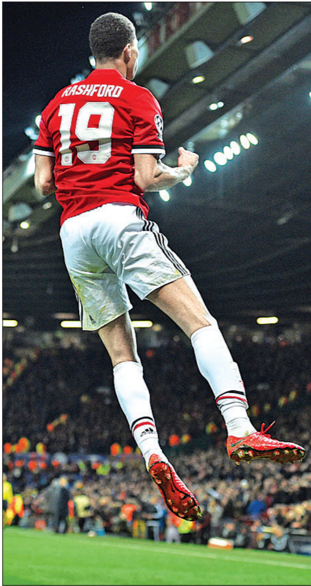
গোলের আনন্দে শূন্যে লাফ ম্যাফেস্টার ইউনাইটেডের মার্কাস রাশফোর্ডের।