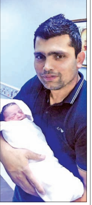
সদ্যোজাত সন্তানের সঙ্গে সস্ত্রীক ভারতীয় ক্রিকেট তারকা রবীন্দ্র উথাপ্পা (উপরে)। তার পিতৃভ্রাতার যাদ পেলেন পাকিস্তানি ক্রিকেটার কামরান আকমল।