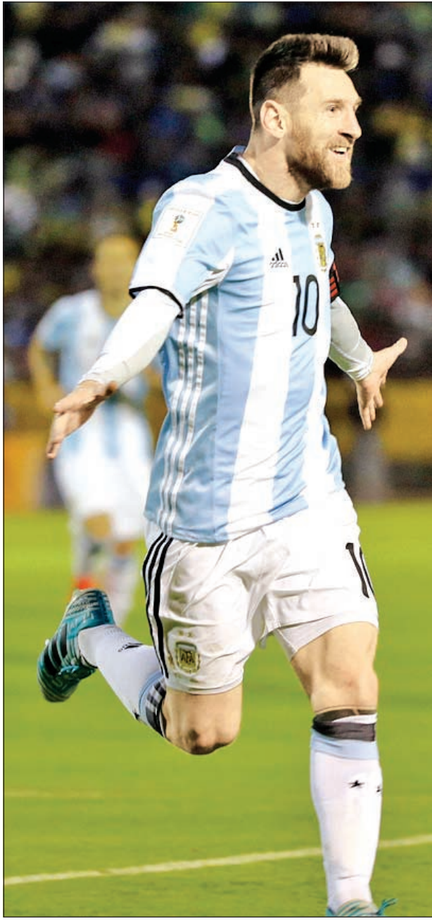
আর্জেন্টিনাকে বিশ্বকাপে তোলার পর উচ্ছ্বাস লিওনেল মেসির।

রফশের খোলসে ঢুকে যায় ইকুয়েডর। বিপক্ষের যে স্ট্যাটেজির সুযোগ কাজে লাগিয়ে আর্জেন্টিনা ম্যাচের দখল নিয়ে নেয় মেসি-আর্জেন্টিনা ডি মারিয়ার যুগলবন্দিতে। ১২ মিনিটে ডি মারিয়ার ডিফেন্স চেরা পাস থেকে অ্যাকাউন্ট খোলেন বার্সার নয়নের মণি। ৮ মিনিট বাদেই আবার মেসি ম্যাজিক। ডি বঙ্গের বাইরে থেকে গোলার মতো শটে গোল করে যান বার্সা সুপারস্টার। প্রথমার্ধের বাকি সময়টাতে ইকুয়েডর তাঁকে শান্ত রাখতে পারলেও ৬২ মিনিটে মেসির হ্যাটটিকে ১৮ ম্যাচে ২৮ পয়েন্ট নিয়ে তৃতীয় স্থানে শেষ করা আর্জেন্টিনার জন্য বিশ্বকাপের টিকিট নিশ্চিত করে। কোচিং জীবনের বৃহত্তম চ্যালেঞ্জ উত্তীর্ণ হওয়ার পর জর্জিও সাম্পাওলির গলাতেও মেসির প্রশংসা ঝরে পড়েছে। তাঁর কথায়, 'মেসি নয়, ফুটবল বিশ্বকাপটাই ওর কাছে ঋণী হয়ে থাকবে। ফুটবল ইতিহাসের সেরা ফুটবলার মেসি। সেটা আজকে ও আবার প্রমাণ করল।'