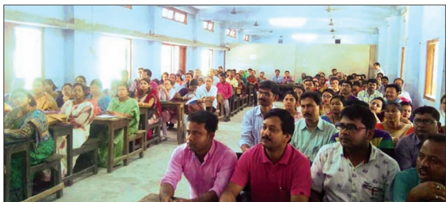
ম্যাকউইলিয়াম হাইস্কুলে কেরিয়ার হাবের কর্মশালায় অংশগ্রহণকারী শিক্ষক-শিক্ষিকারা। -সংবাদচিত্র

আলিপুরদুয়ার, ১৮ মে : প্রাথমিক বিদ্যালয়ের ছাত্রছাত্রীদের কম্পিউটার প্রশিক্ষণের ব্যবস্থা করার পর এবার মাধ্যমিক এবং উচ্চমাধ্যমিক বিদ্যালয়ের ছাত্রছাত্রীদের ভবিষ্যৎ পেশা বেছে নেওয়ার জন্য বিশেষ প্রশিক্ষণ চালু করেছে চলেছে রাজ্য শিক্ষা দপ্তর। নবম থেকে দ্বাদশ শ্রেণি পর্যন্ত ছাত্রছাত্রীদের পৃথিব্যত পড়াশোনার পাশাপাশি তারা যাতে তাদের মেধা এবং পছন্দ অনুযায়ী পেশা স্কুলে থাকতেই বেছে নিতে পারে সেজন্য প্রতিটি স্কুলে বিশেষ 'কেরিয়ার হাব' গঠন করতে চলেছে শিক্ষা দপ্তর।