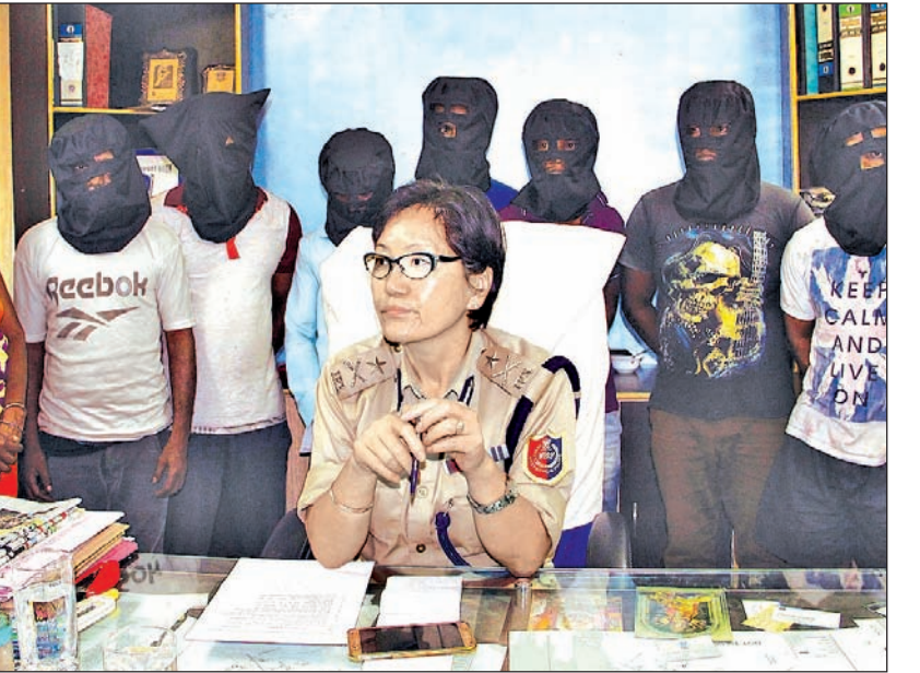
মহাবীরহানে ব্যবসায়ী খুনের ঘটনায় খুঁড়দের নিয়ে পুলিশ কমিশনার।