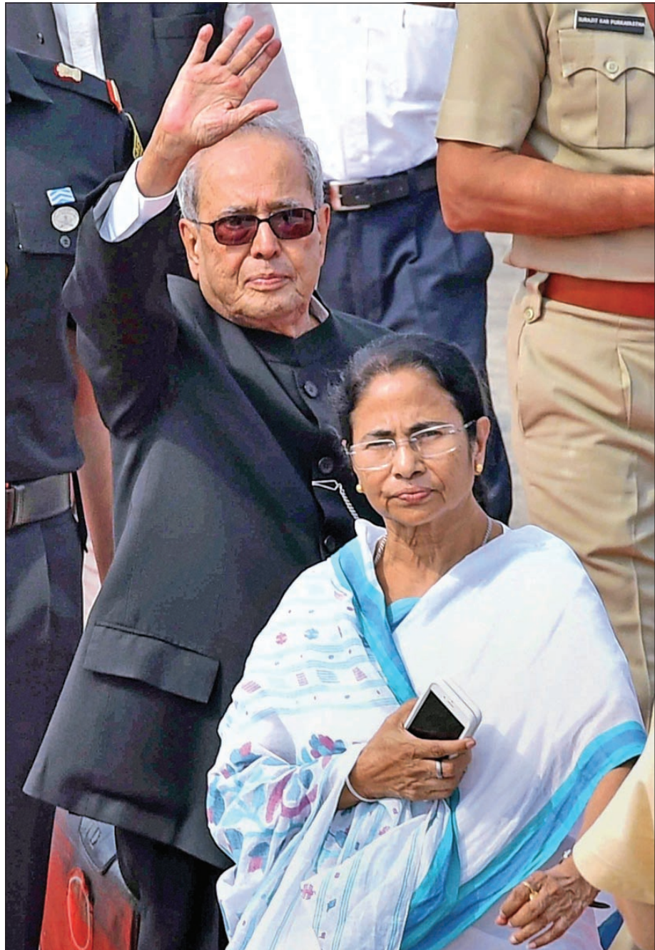
বৃহস্পতিবার কলকাতা বিমানবন্দরে রাষ্ট্রপতি প্রণব মুখোপাধ্যায়ের সঙ্গে মুখ্যমন্ত্রী মমতা বন্দোপাধ্যায়।